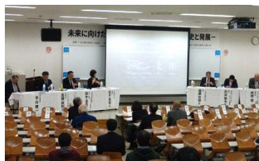
パネルディスカッションの様子