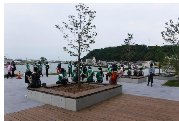
堤防やテラス、完成した堤防天端の腰掛けで休む人々