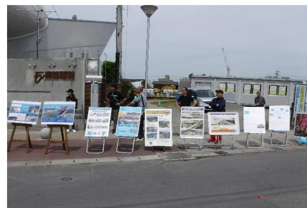
復興ウォーキングにあわせてパネル展を実施！多くの皆さまにご覧いただきました！