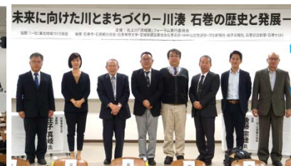
シンポジウム終了後の記念撮影