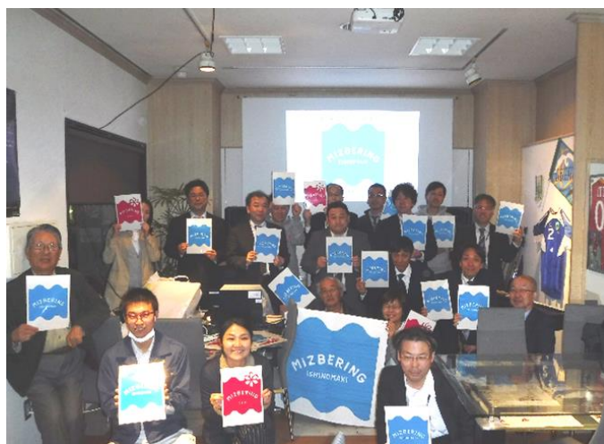
今年度も“ミズベリング石巻”を盛り上げます！