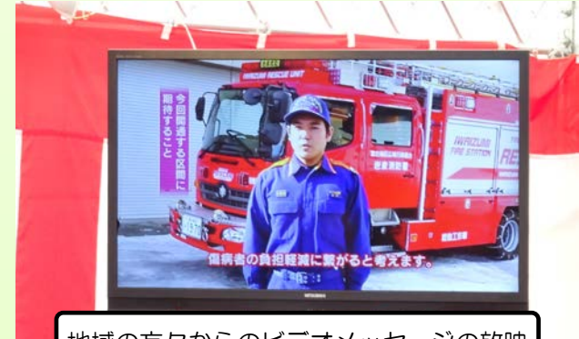
地域の方々からのビデオメッセージの放映