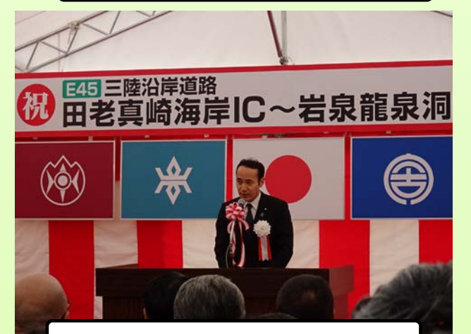
築 国土交通大臣 政務官の挨拶