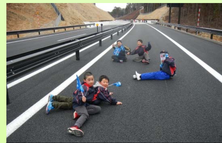
路面に寝転がって、記念撮影!