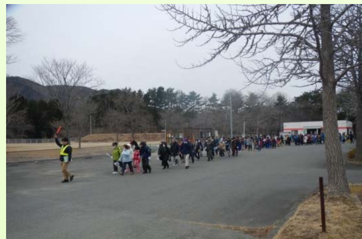
11時45分に集合場所のグリーンピアみやこを出発