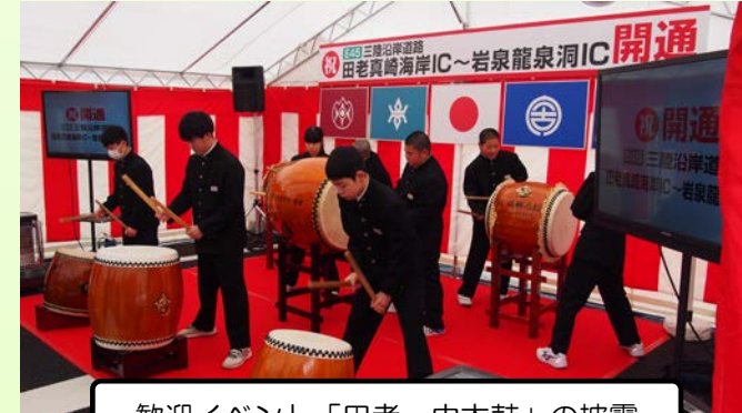
歓迎イベント「田老一中太鼓」の披露

開通に先立ち、田老真崎海岸IC付近にて、国土交通省、岩手県、地元自治体の首長をはじめ、各関係機関、工事関係者、地元関係者約650人にご列席いただき、開通式典が盛大に執り行われました。式では、「田老一中太鼓」の披露や地域の方からのビデオメッセージの放映などのオープニングセレモニーや開通を祝してテープカット・くす玉開き、開通記念パレードなどの開通記念セレモニーが行われました。