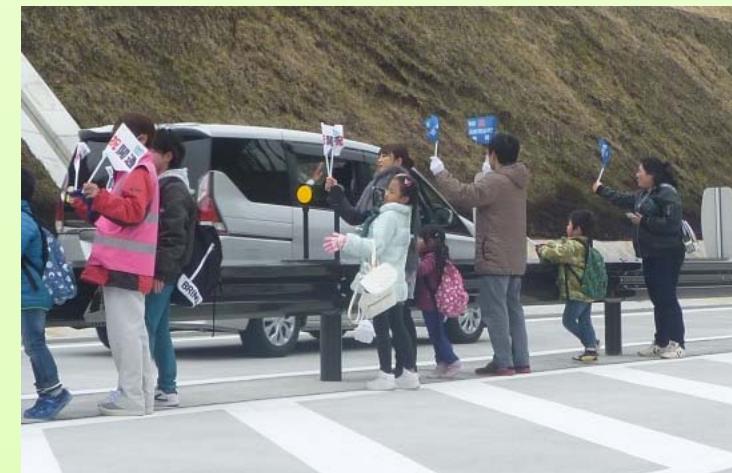
小旗を振ってパレードを盛り上げていただきました