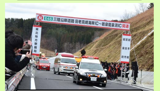
開通記念パレードの出発