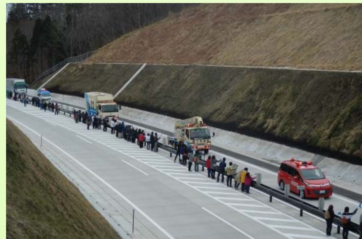
開通記念セレモニーのパレードとのすれ違い状況