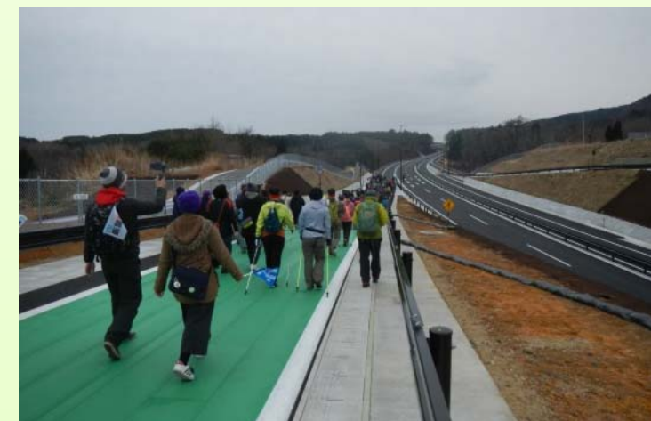
田老北インターのオンランプから開通区間へ進入