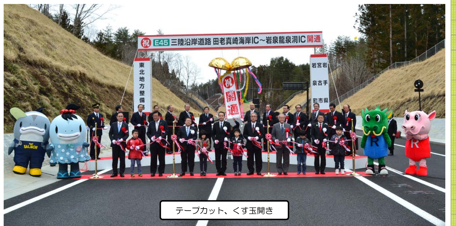
テープカット、くす玉開き