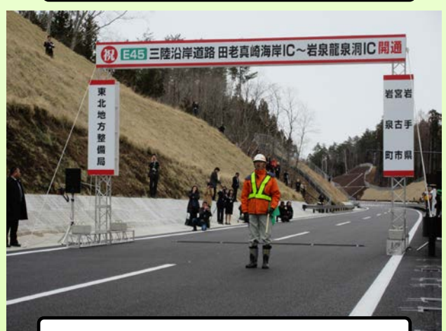
三陸国道事務所によるパレード出発合図