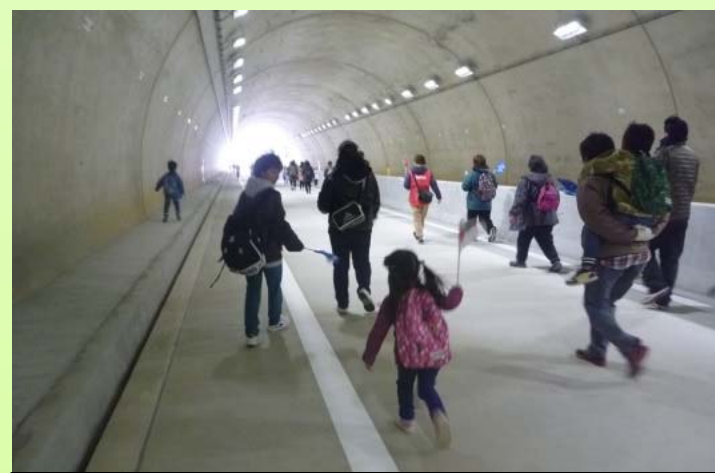
トンネルの中も歩きました