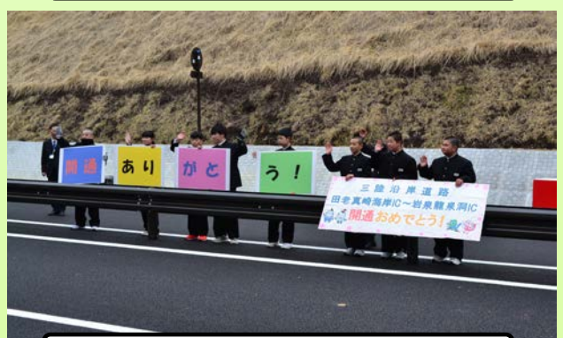
パレードのお見送り

三陸国道事務所では、復興事業の促進を図るため、国内初の「事業促進PPP(※)」を導入しています。事業促進PPPとは、官民がパートナーを組み、双方の技術・経験を活かしながら効率的なマネジメントを行うことにより事業の促進を図るものです。「田老普代工区だより」は、三陸沿岸道路の宮古市田老から普代村間を担当する事業促進PPPが、事業者と住民の皆様とのコミュニケーションツールとしてお届けします。