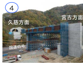
新柳瀨橋上部工工事 施工:(株)東京鐵骨橋梁