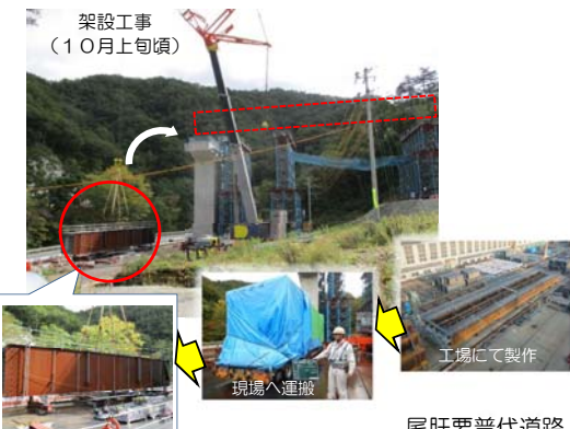
架設工事（10月上旬頃）

3. 架設工事 工場にて製作した橋桁を大型トレーラーで工事現場へ運び、クレーンを使って土台の上へ持ち上げ、載せました。