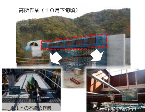
高所作業（10月下旬頃）

4. 高所作業 橋の土台の上へ持ち上げた橋桁に、点検用の通路を取り付けたり接続用のボルトしっかりと締めます（本締め）。