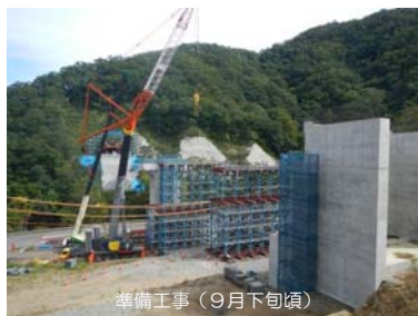
準備工事（9月下旬頃）

2. 準備工事 作業用の階段や、工事中の仮の支えとなる構造物（バント）の組立てを行いました。