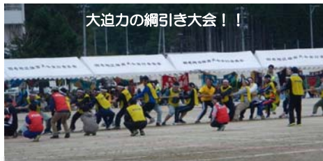
大迫力の綱引き大会！！