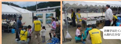
お菓子はたくさん取れたかな？