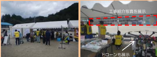
工事紹介写真を展示