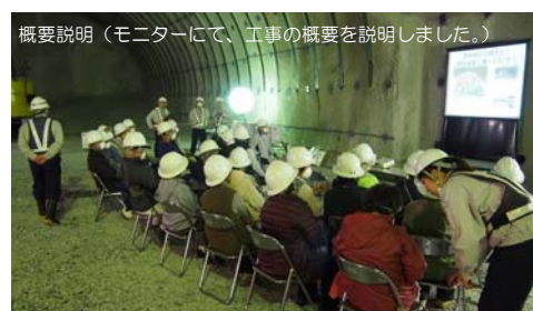
概要説明（モニターにて、工事の概要を説明しました。）

10/9（日）に摂待地区の住民の皆様を招いての貫通式（現場見学会）を開催しました。24名もの地元の皆様と迎えた貫通の瞬間は大変感動致しました。トンネルは無事貫通しましたが、今後は開通に向けた工事を進めていきます。最後まで安全第一で取り組んでいきますので、工事に対するご理解とご協力をよろしくお願い致します。