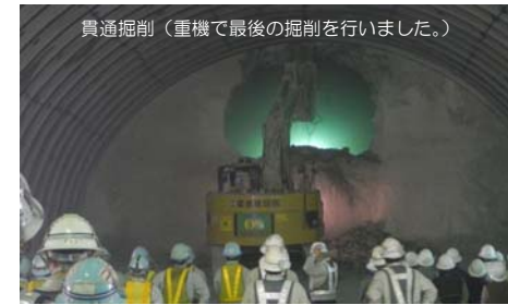
貫通掘削（重機で最後の掘削を行いました。）