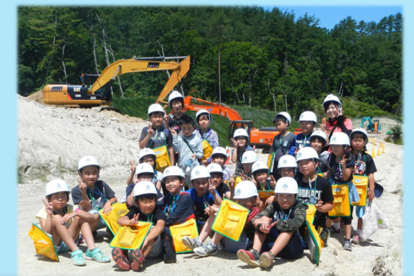
暑い日差しの中、ヘルメット姿の元気な24名です。

東日本大震災後の「田野畑の復興はどこまで？」というテーマで学習を進める中で、田野畑村立田野畑小学校の4年生（24名）が尾肝要普代道路の工事現場（村本建設(株)）を訪れ、復興道路の進み具合を確認し、工事現場で働く人に“仕事に携わる思い”などを勉強しました。（7月12日）