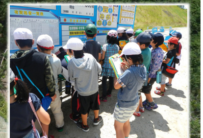
熱心にメモ記録しています。

子供たちは、道路の完成時期の質問をする他に、仕事に携わる中で“気を付けている事”や“嬉しかった事”などを活発に訊ねていました。