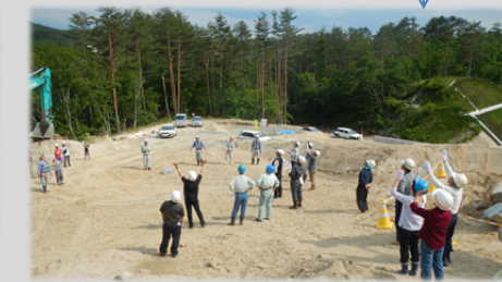
GPS積載の掘削機械にも興味。