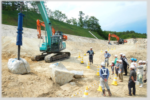
岩塊を砕く時(くさびを打ち込む)の作業音の大きさを確認・体感しています。

田野畑地区道路改良工事(株)森本組では、田野畑村巢合地区の皆さんを対象に工事現場見学会を6月4日(土)に行いました。 見学会では硬い岩盤や大きな岩塊の破碎作業を、ドリルや破碎機等の特殊機械を用いて工事騒音の抑制に留意している事や、破碎時の作業音などを確認・体感して頂きました。