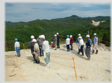
山の尾根筋から、自宅の位置等を確認しています。

見学者の方からは、「工事現場で見た大きな岩の塊を、特殊な機械を使って騒音を減らそうと努力している事が分かった」「見学会をまた開いて」「事業を応援している。早く道路を利用させて」等の、多くの期待のお声も頂きました。