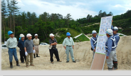
三陸沿岸道路の整備効果のパネル説明