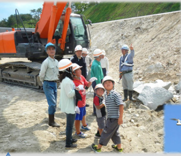
“ドローン”による空中からの撮影に手を振って応えています。

参加者の方々はヘルメットを持参するなど工事現場に関心が高い方が多く、三陸沿岸道路の整備効果等のパネル説明にも関心を示されていました。 また、地区を見渡す尾根筋の工事現場から、自宅の位置の確認や三陸沿岸道路のルートを確認を親子で行う等、この道路の一日も早い完成を願っていました。