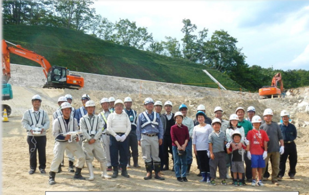
巢合地区の見学者の皆さんと集合写真です

見学者の方からは、「工事現場で見た大きな岩の塊を、特殊な機械を使って騒音を減らそうと努力している事が分かった」「見学会をまた開いて」「事業を応援している。早く道路を利用させて」等の、多くの期待のお声も頂きました。