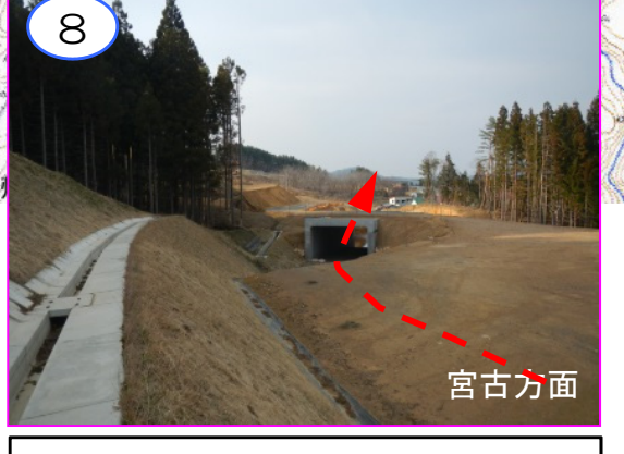
8 宮古方面 宮古方面から来た車両が(仮称)田野畑インターチェンジで流出する道路付近です。本線部や宮古方面への流入路等の工事は今後整備します。