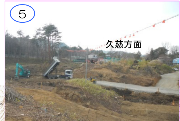
5 久慈方面 沢部の排水管渠工事の進入路造成を進めています。