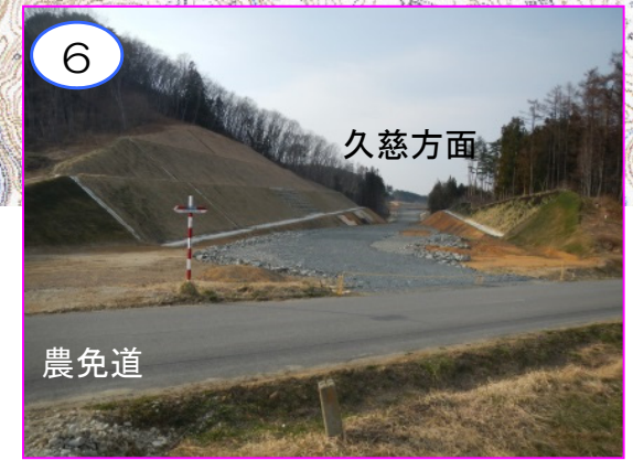
6 久慈方面 菅窪地区の農免道菅窪線交差付近の切土区間です。交差構造物や本線部の切り下げ工事は今後整備します。