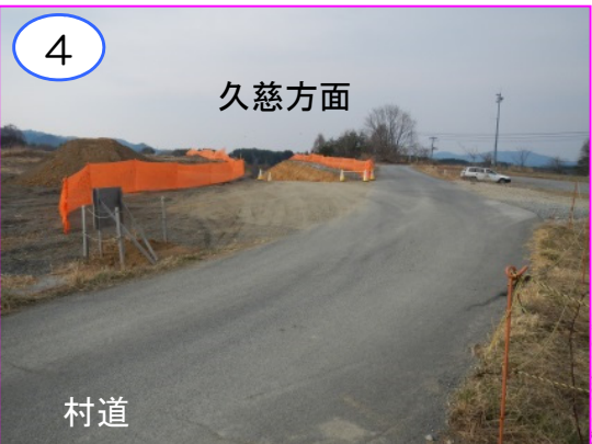
4 久慈方面 排水管渠工事および盛土工事に使用する進入路の出入口です。