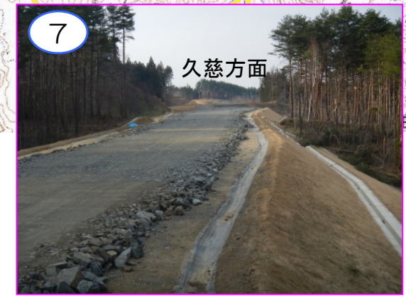
7 久慈方面 菅窪地区の農道菅窪線交差部と(仮称)田野畑インター間です。盛土は完成形に仕上がっています。