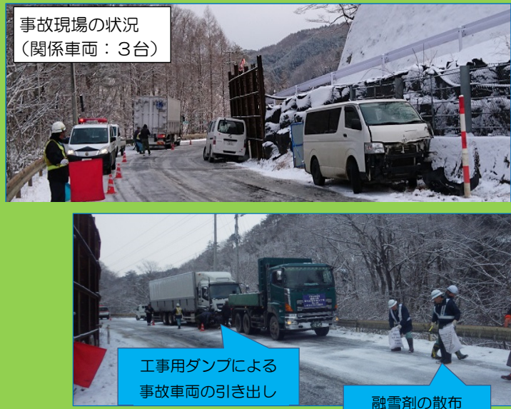
事故現場の状況 (関係車両：3台)

「事故の概要」 3月上旬、朝の通勤時間帯に国道45号で降雪路面でスリップしたワゴン車や大型トラックなど計3台関連の交通事故が発生。 「臨機の支援概要」 ・近傍で工事中の工事関係者(青木あすなろ建設(株))が事故現場に急行し、現場警察官の要請を受けて、以下の事故処理支援を行い、早期の交通確保に取り組みました。 ①、事故車両の早期排除支援(工事用ダンプで事故車両の引き出し) ②、融雪剤の散布による圧雪路面の早期回復の支援 ※青木あすなろ建設(株) 社員等5名、ダンプ1台、融雪剤 (※「柏木平地区トンネル工事」「普代南地区改良工事」)