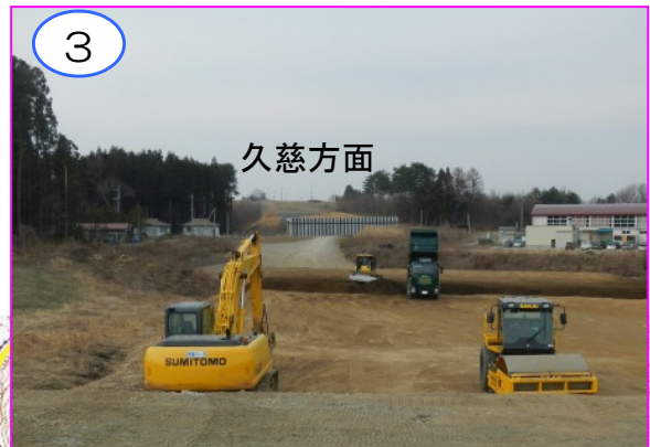
3 久慈方面 鳥越地区の広い沢部の盛土工事を進めています。