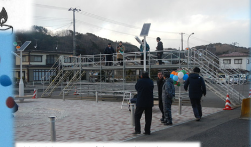
普代村長さんが会場設営の激励に