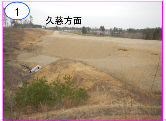
1 久慈方面 大芦地区の深く広い沢部の盛土工事を進めています。