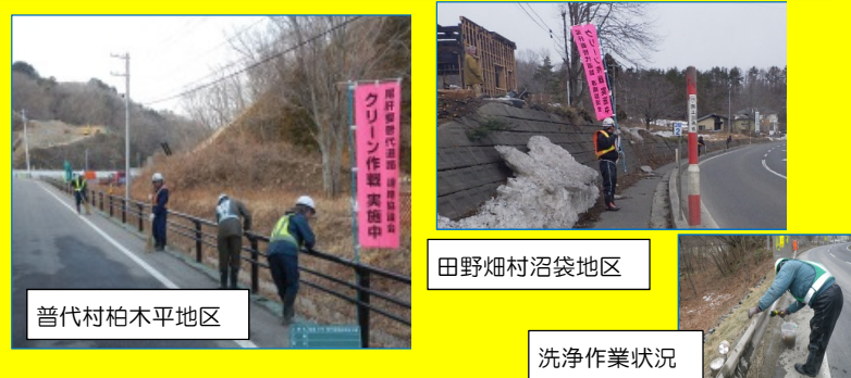
普代村柏木平地区

・表記安全協議会では、大型ダンプで土砂運搬などで利用している道路の清掃活動を行いました。 ・日頃の工事利用に感謝を込めて、視線誘導標の汚れや道路の路側の汚れを水洗いやホウキにより清掃しました。 ・この道路美化活動を通して、工事関係者のより一層の安全意識の向上を図るため、今後も定期的な清掃活動を取り組んでいきます。