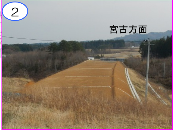
2 宮古方面 鳥越地区の盛土区間です。盛土は完成形に仕上がっています。