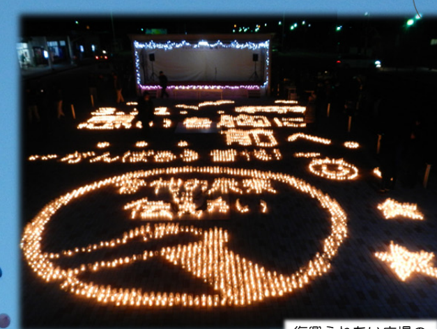
復興ふれあい広場のキャンドル点灯

イベント会場ではこの5年の歩み「思いを胸に前へ」を心に刻みながら、キャンドル点灯やバルーンリリース、ミニLIVE等で追悼いたしました。希望の光を灯すこの追悼イベントの様子は、翌日の新聞記事に311個の風船が一斉に放たれる状況やキャンドルへの点灯等、広い紙面で紹介されました。