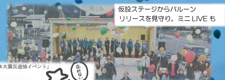
仮設ステージからバルーンリリースを見守り。ミニLIVEも