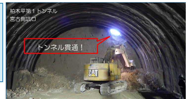
柏木平第1トンネル 宮古側坑口