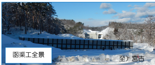
函渠工全景 至) 宮古

先日の大雪強風に伴う倒木等による長時間の停電障害の件につきまして、お見舞い申し上げます。 私共の工事は、昨年4月に工事着手して以来、近隣の皆さま並びに関係者の皆さまのご協力とご支援のもとに、切盛り土工や地盤改良工事、函渠工事を担当し、おかげ様で無事に工事の完了を迎えました。この紙面をお借りして厚くお礼申し上げます。 三陸沿岸道路の一日も早い完成を祈ります