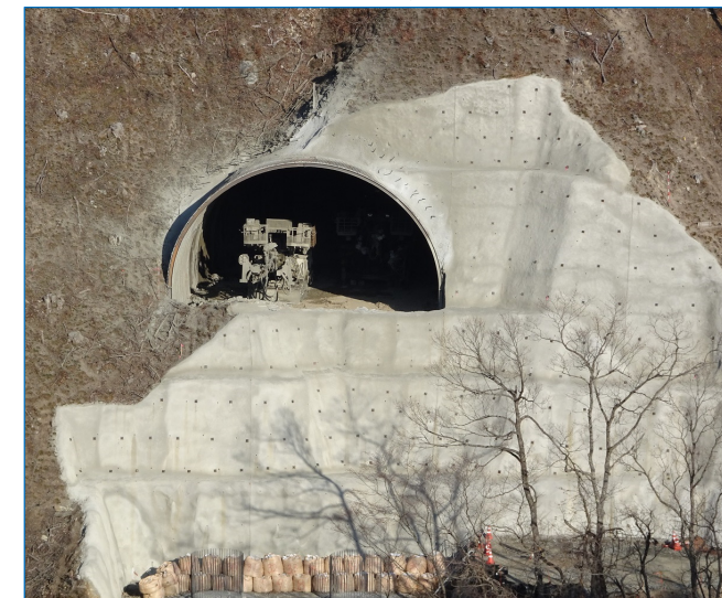
宮古側坑口のトンネル掘削機械が、姿を現わしました！ ⇒坑口の下方では、新柳瀨橋の橋台工事が進んでいます。