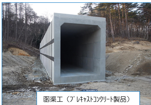
函渠工 (プレキャストコンクリート製品)

沼袋北地区道路改良工事を担当しました 昭栄建設(株)です。 ～昨年4月の工事着手以来10ヶ月間、おかげ様で無事に工事完了しました！～