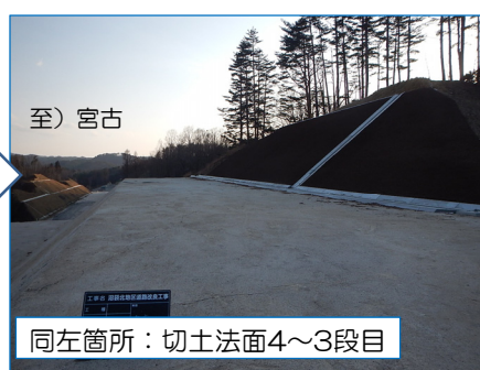
同左箇所：切土路面4～3段目

尾肝要地区の函渠の状況です。 ・盛り土構造となる三陸沿岸道路を横切って海側地域と山側地域とを結び、地域の皆さまにご利用頂くようになる通路(コンクリート製の函渠)です。 本工事では、工場で作成したコンクリートの部材を現場で組立てて仕上げました。