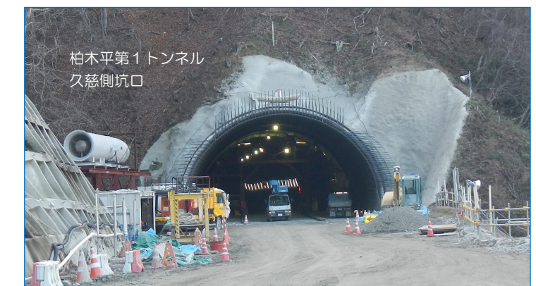
柏木平第1トンネル 久慈側坑口