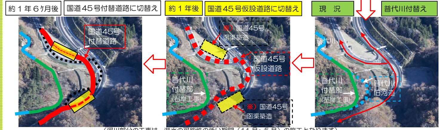
(河川部分の工事は、洪水の可能性の低い期間(11月~5月)の施工となります)