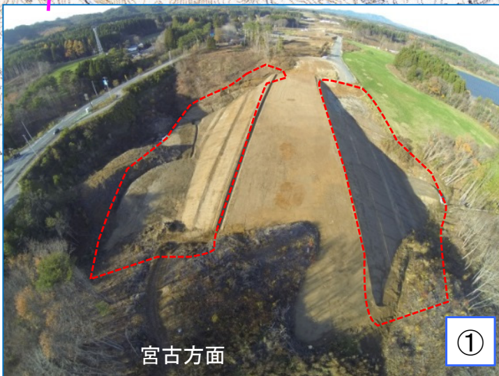
大芦地区の盛土区間の状況 (上空から撮影)

・深い沢部に道路の計画高まで暫定形に盛り土を立ち上げています。 この部分は田野畑南インターに近いため道路幅が広く、今後の後発工事で両側の盛土施工を行います。