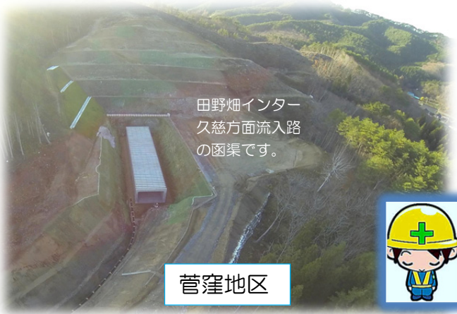
田野畑インター久慈方面流入路の函渠です。