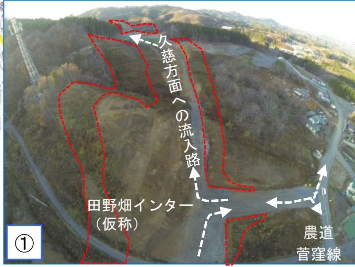
菅窪地区 田野畑インター(仮称)部の切土区間の状況(上空から撮影) ・久慈方面への流入路を先行して函渠設置工事・切土工事を進めました。