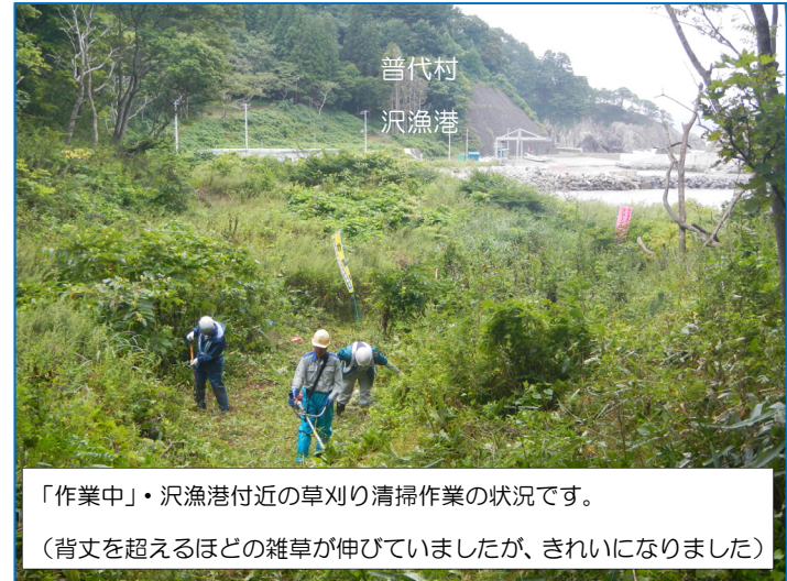
「作業中」・沢漁港付近の草刈り清掃作業の状況です。 (背丈を超えるほどの雑草が伸びていましたが、きれいになりました)