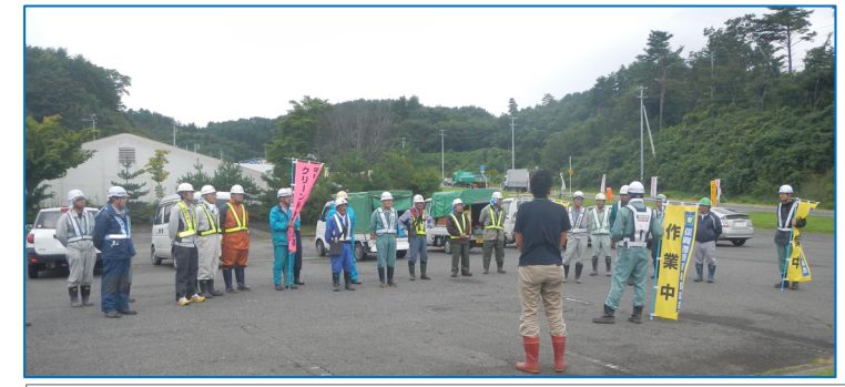
作業前の打合せ状況です。(普代村の担当者と安全協議会メンバー23名)

この内、普代村ルートの沢漁港から約1.2km間の古い街道筋は、笹タケや雑草繁茂の荒れた状態である事から、普代村と田野畑・尾肝要普代道路の工事安全協議会が相談し、協議会活動として草刈り清掃などの環境整備に協力しました。(8月26日)