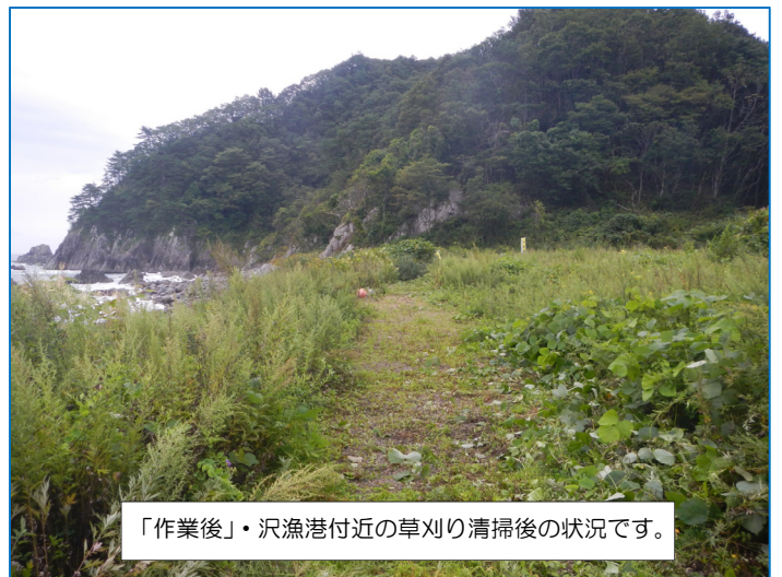
「作業後」・沢漁港付近の草刈り清掃後の状況です。