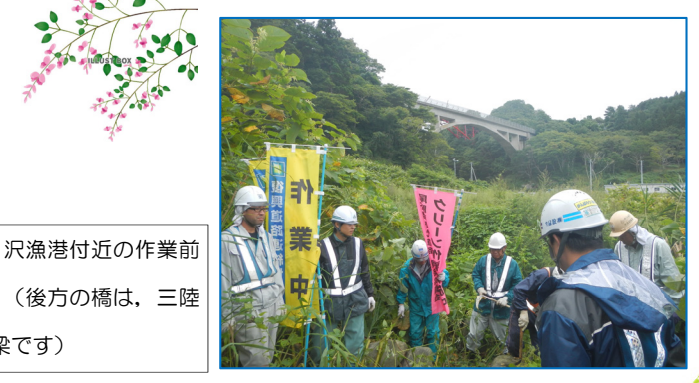
「作業前」・沢漁港付近の作業前の状況です。(後方の橋は、三陸鉄道大沢橋梁です)

【参考】:「みちのく潮風トレイル」とは、青森県八戸市から福島県相馬市までの海岸線を中心に設定されるトレイルコースで、「トレイル」とは森林や里山、海岸、集落等を通る「歩くための道」のことです。