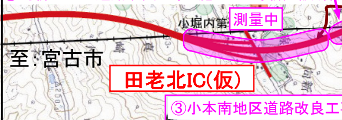
③ 小本南地区道路改良工事 施工:小野新建設(株)