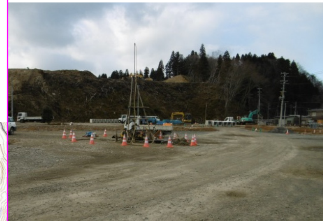
⑥ 岩泉地区道路工事 施工:東亜建設工業(株)

国道45号とオオカン沢を跨ぐ下摂待橋の起点側橋台が完成し、摂待第2トンネル終点側坑口への工事用道路を整備しています。