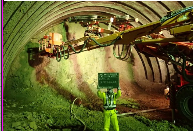
② 摂待道路工事 施工:大成・銭高・東コンJV

摂待第1トンネル起点側でも掘削が始まり、1月24日現在、55.8m掘り進んでいます。