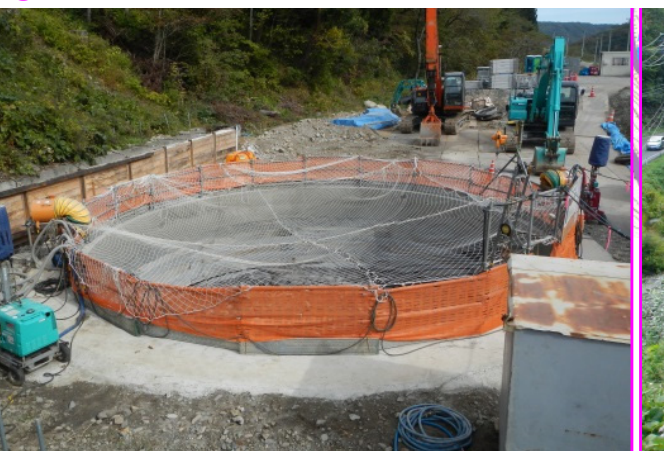
②摂待道路工事 施工:大成・銭高・東コンJV

表面でお知らせしたとおり、摂待第1トンネルを掘る準備が整い、安全祈願祭を行いました。