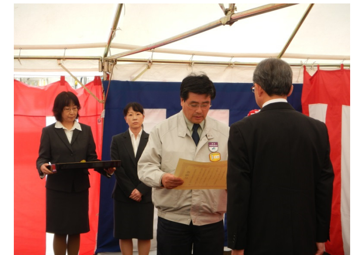
「未来の笑顔プラント」愛称および図案募集の協力に対し，田老第三小学校長へ感謝状の贈呈