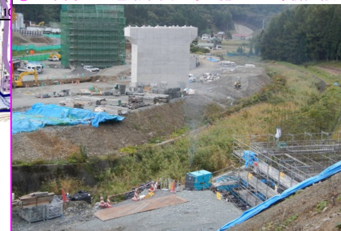
⑥新小本大橋上部工工事 施工:(株)東京鉄骨橋梁

新小成橋の橋脚と中足場解体中の終点側橋台(写真奥)に続き、手前では起点側橋台の鉄筋組立を行っています。