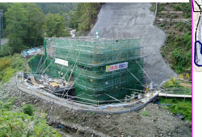
④小本南地区道路改良工事 施工:小野新建設(株)

国道45号とオオカン沢を跨ぐ下摂待橋の起点側橋台の鉄筋を組み上げています。工事用道路も整備中です。