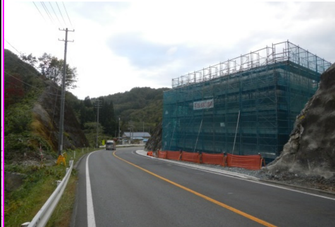
③下摂待地区道路改良工事 施工:三好建設(株)

下摂待橋の終点側橋台のコンクリート打設が終わり、型枠の解体を行っています。ご迷惑をおかけしていた国道の終日片側交互通行は終了しました。