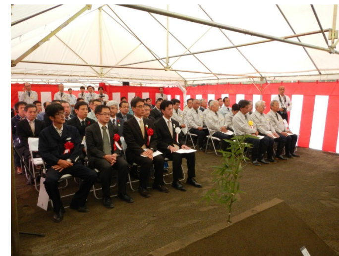
地域の代表の方，工事関係者が多数出席