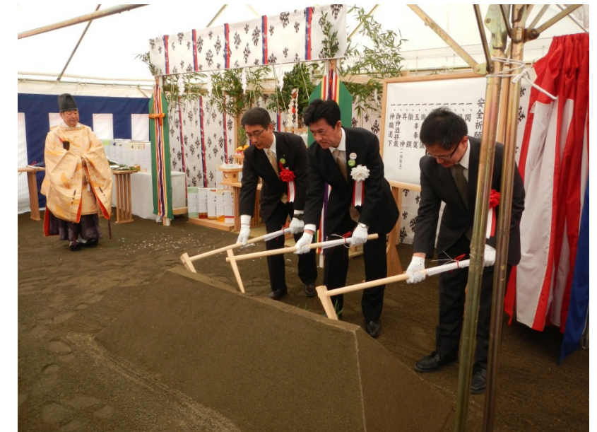
国交省，岩手県，宮古市の代表者による鍬入れ

当日は，地域の代表の方々も出席され，工事の安全を祈念して神事が執り行われた他，三陸沿岸道路専用公共プラント「未来の笑顔プラント」の愛称およびPRボード図案の応募等の協力に対し，田老第三小学校への感謝状の贈呈が行われました。