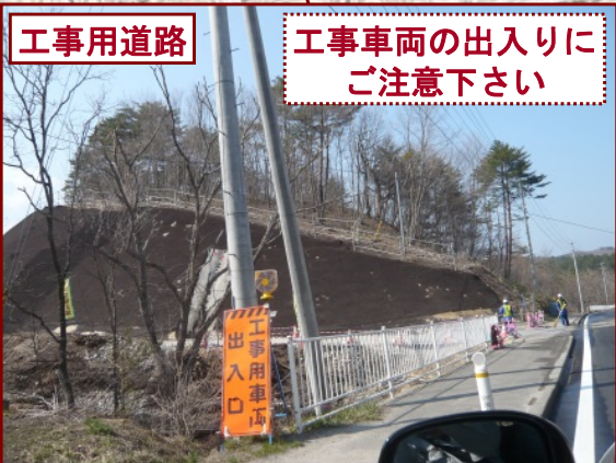
② 柏木平地区道路改良工事 施工: 昭栄建設(株)

本線の下を国道45号と山側とを行き来するための函渠工と土工工事を行い、当工事としてはH26年2月に完成しました。引き続き、①工事の樋下建設が盛土を施工しています。