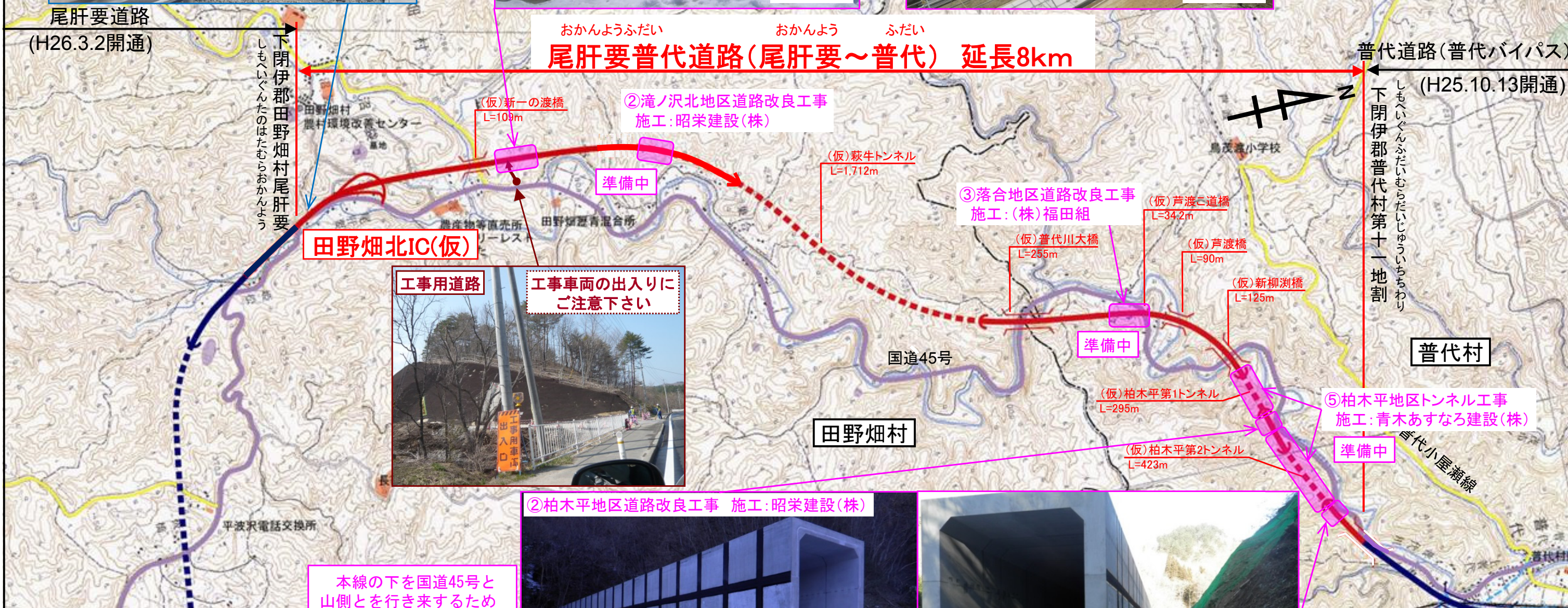
普代道路(普代バイパス) (H25.10.13開通)