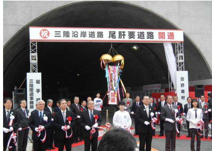
テープカットとくす球開披

開通に先立ち、11時から開通式典が行われ、テープカット、くす球開披、パレードのほか、地域の方々の菅窪鹿踊、田野畑小学校スクールバンド演奏により華を添えていただきました。