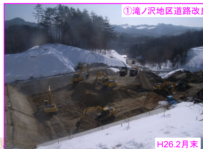
① 滝ノ沢地区道路改良工事 施工: 樋下建設(株)