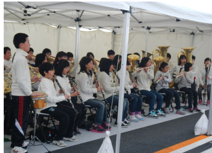
田野畑小学校スクールバンドの演奏

三陸国道事務所では、復興事業の促進を図るため、国内初の「事業促進PPP (※) 」を導入しています。事業促進PPPとは、官民がパートナーを組み、双方の技術・経験を活かしながら効率的なマネジメントを行うことにより事業の促進を図るものです。復興道路を早期に整備するため、膨大な業務の実施が必要となっていますが、今まで官の業務範囲であった事業進捗管理、業務工程管理、地元への説明、関係機関との協議・調整、用地取得計画調整などを新たに民間のチームを加えて実施しています。