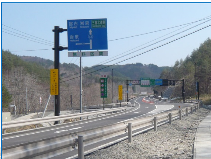
尾肝要道路 (H26.3.2開通) 終点部