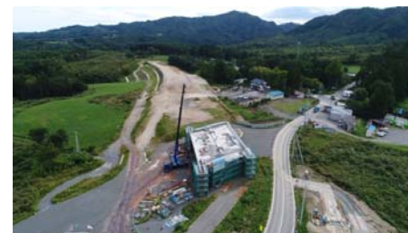
〔9月〕作業が順調に進捗(進んで捗ること)