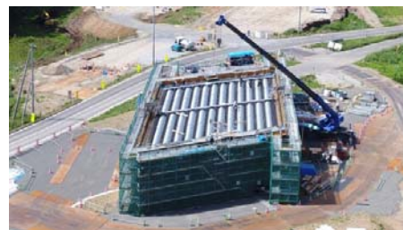
(逆方向から拡大撮影)

この橋は、通行する荷重を支える床版の重さを軽くするために、中が空洞に設計されています。6月の写真には、銀色の金属型枠が並んでいます。