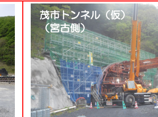
⑤施工：前田建設工業(株)