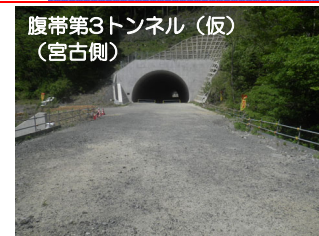
⑬施工：岩手ニチレキ(株)

川井第1トンネル(仮)では、覆工コンクリートの施工を行っています。全長1,764mのうち1,110mまでコンクリート打設が進んでいます。