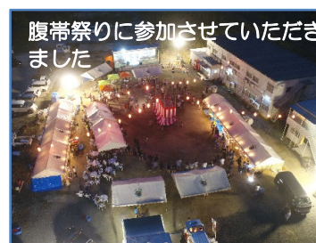
腹帯祭りに参加させていただきました