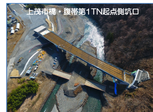
上茂市橋・腹帯第1TN起点側坑口