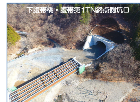
下腹帯橋・腹帯第1TN終点側坑口