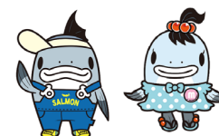
サーモンくん みやこちゃん