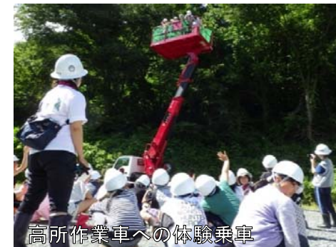
高所作業車への体験乗車