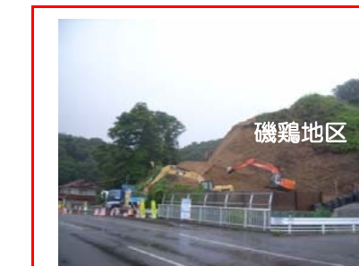
磯鶏地区で山を掘削し土砂搬出を行っています。