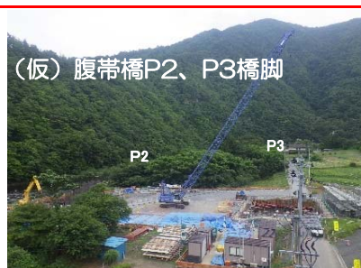
(仮)腹帯橋P2、P3橋脚。P2橋脚ではコンクリート打設が終わり埋め戻しを行っています。P3橋脚では底盤部の鉄筋を組立っています。