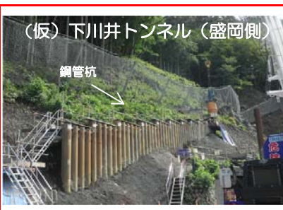
(仮)下川井トンネル(盛岡側)のトンネル坑口付近の法面を安定させるために直径約45cmの鋼管杭で壁を作っています。