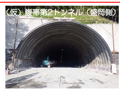
(仮)腹帯第2トンネル(盛岡側)。8月からの覆工コンクリート打設のため準備を進めています。坑内では引き続き※2インバートを施工しています。