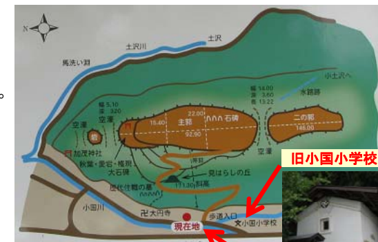
旧小国小学校近くの重厚な蔵の前に説明看板と登城口があります