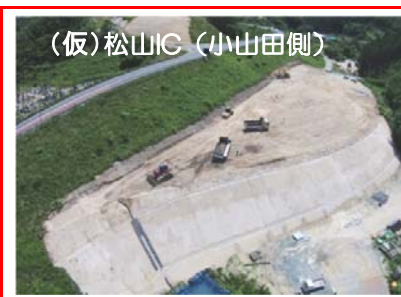
(仮)松山IC(根市側)では切廻し道路の盛土を行っています。