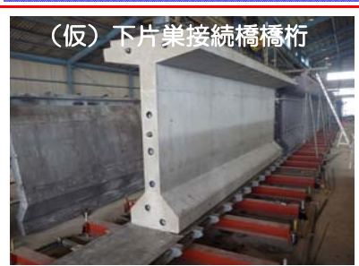
(仮)下片巣接続橋橋桁。写真は工場で作成中の橋桁です。この橋桁を現場で連結し、架設していきます。