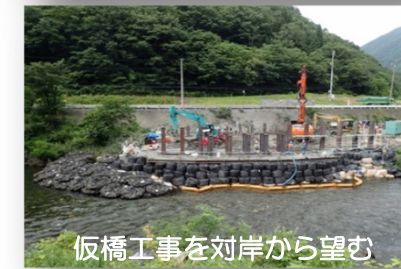
仮橋工事を対岸から望む