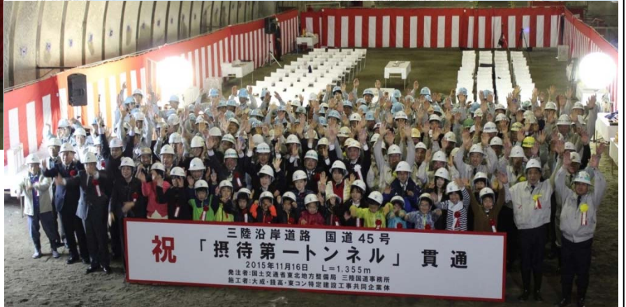
トンネル貫通点で貫通を祝いました