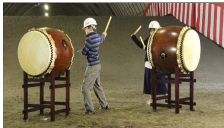
児童による田老太鼓披露