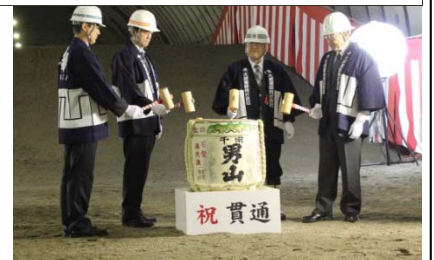
貫通を祝い鏡開き