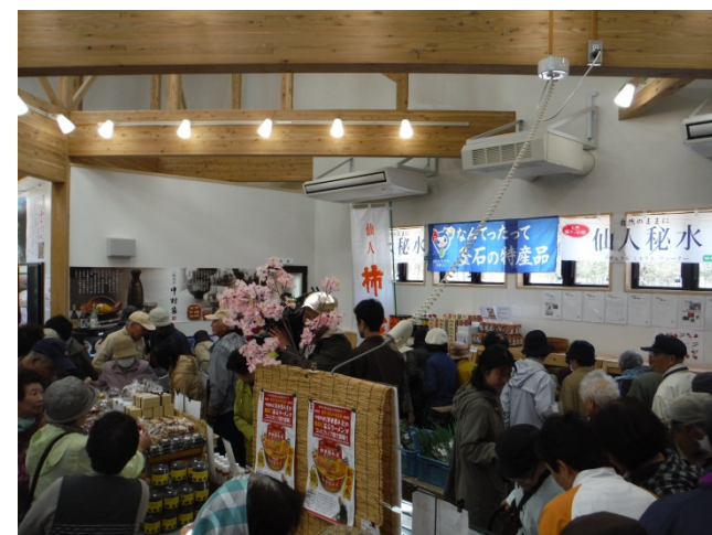
▲大賑わいとなった産直コーナー