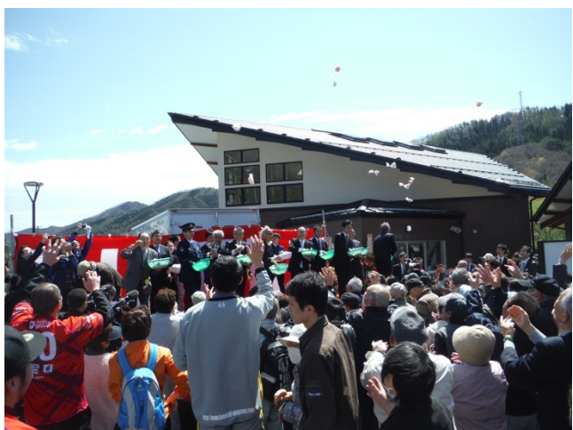
▲お祝いの餅まきで大盛り上がり