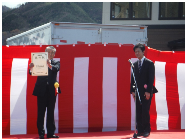
▲道の駅登録証伝達