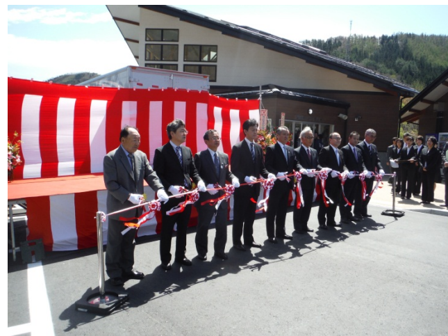
▲関係者によるテープカット