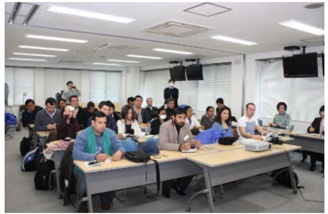
▲熱心に耳を傾ける参加者のみなさん