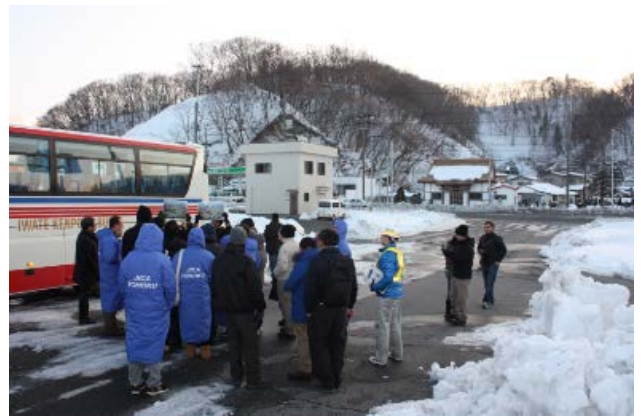
▲宮古盛岡横断道路起点（藤原埠頭 出入り口付近）で現場研修