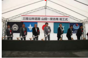
▲山田宮古道路 H25.6.17着工