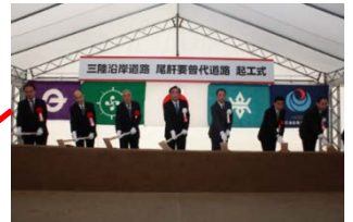
▲尾肝要普代道路 H25.11.18着工