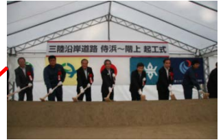
▲洋野階上道路 H25.9.12着工