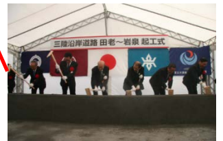
▲田老岩泉道路 H25.3.27着工