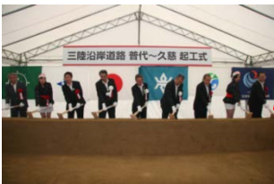
▲野田久慈道路 H25.6.27着工