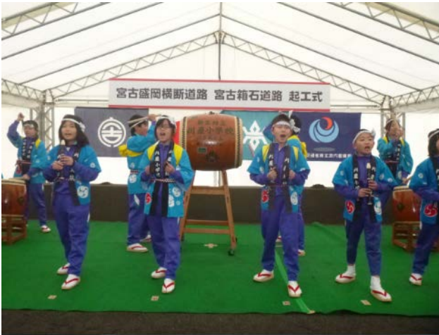
▲刈屋小学校生徒による刈屋太鼓が式典を大いに盛り上げました