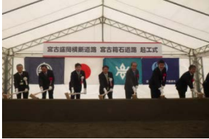
▲宮古箱石道路 H25.11.30着工