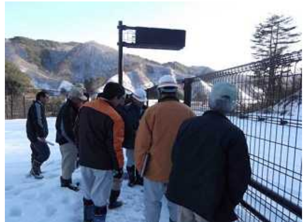
視察する普代村議員の方々