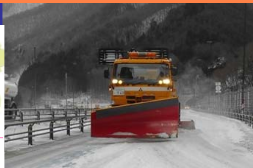
一般除雪(除雪トラック)