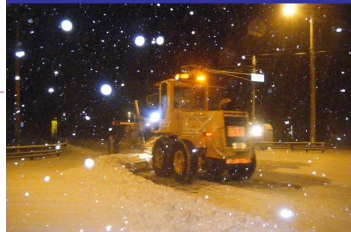
一般除雪(除雪グレーダ)