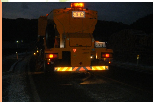
薬剤散布(凍結抑制剤散布車) 一般除雪(凍結抑制剤散布車)