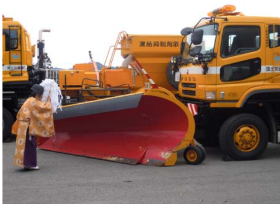
安全祈願式の様子