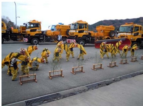
へいたっこ虎舞の様子