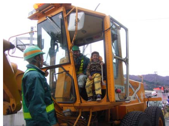
除雪機械体験学習の様子