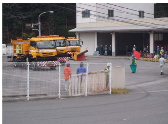
除雪出動式の様子