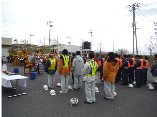
◆ 「安全祈願祭」の様子