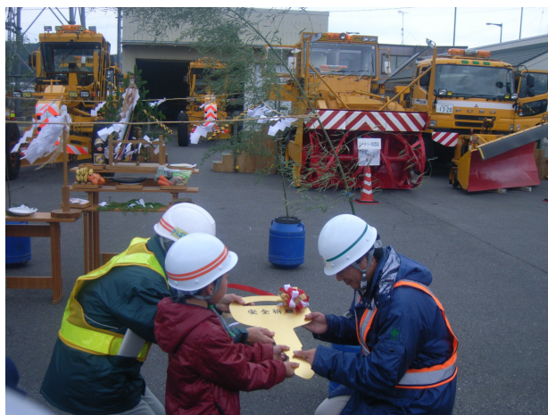
◆ 「出動式（除雪機械鍵引渡し）」の様子