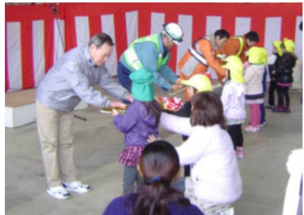
園児による鍵の引き渡し