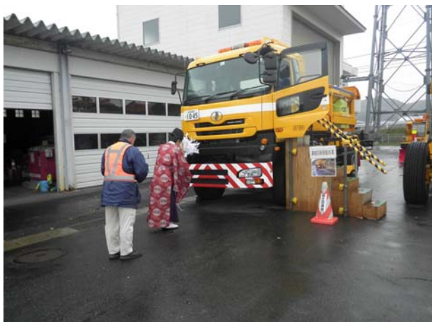
◆「安全祈願祭」の様子