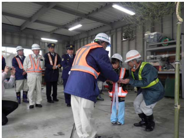
◆「出動式（除雪機械鍵引渡し）」の様子