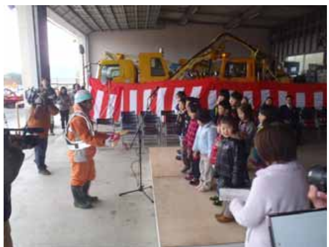
園児による鍵の引き渡し