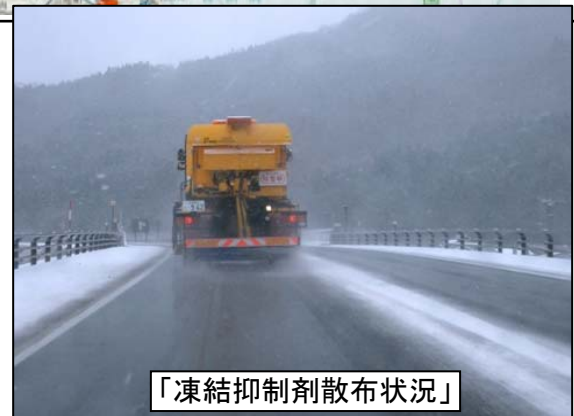
「凍結抑制剤散布状況」