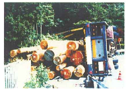
▲線形不良区間(恋の峠)での横転事故