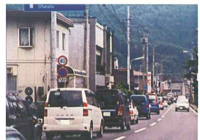
▲釜石市鶴住居地区の渋滞状況