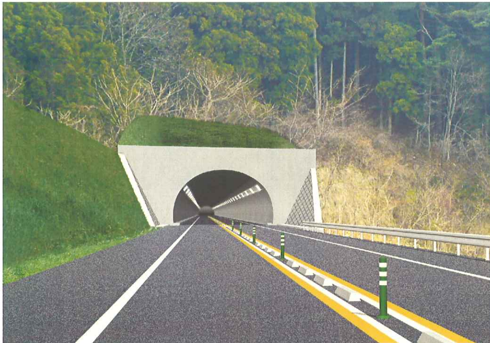
(恋の峠トンネル起点側坑口 完成イメージ)

【契約額】 698,250千円 【工期】 H20. 3. 1~H21. 2. 6