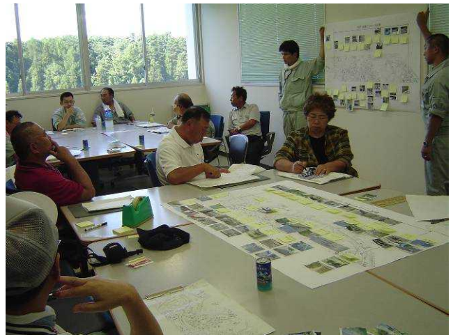
【道路パトロール後の検討会】