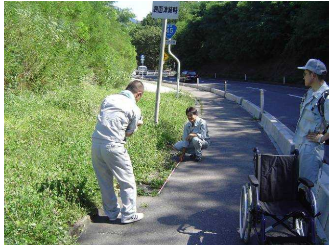
【道路パトロールの実施状況】