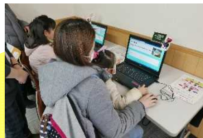
白神山地をアピールするイベントを青森市で開催。津軽ダムはパネル展示・ダムクイズ・ダムパズルで参加しました。