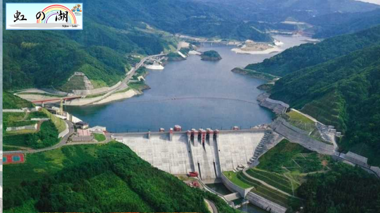
浅瀬石川ダム Aseishikawa Dam