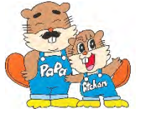
浅瀬石川ダムキャラクター あっちゃんパパ

浅瀬石川ダムでは、先の『虹の湖デュアスロン』や『ダム湖ふれあいデー』、そして今回の『虹ロック』など、ダム湖やその近辺でのイベントを楽しく、そして安全に行えるように管理していきますが、利用される方もゴミの投げ捨てなど「しない・させない」ようご協力をお願いします。