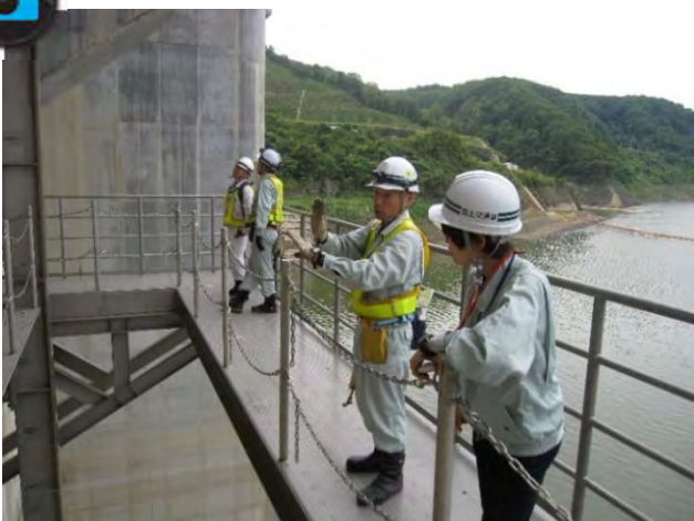
▲水面から約20mの高さでの設備点検。スリルあり！？▲