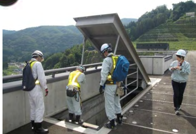
▲『ダムの天端』に入り口出現！？▲