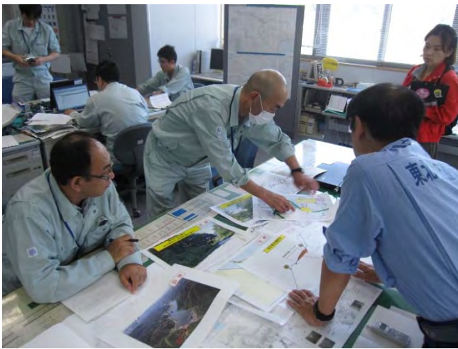
▲支部での被災状況箇所の確認。対応方針の検討▲

平成29年9月1日（金）岩木川ダム統合管理事務所総合防災訓練が実施されました。統合管理されて初めての訓練であり、浅瀬石川ダムと津軽ダムの2つのダムの災害時における“情報連絡体制”及び“状況把握”が円滑におこなえるかが重要なポイントになりました。 訓練は事務所管内で震度6弱の揺れを観測したとの想定で災害対策支部が設置され、職員及び家族の安否確認、防災広報、管理施設点検、応急復旧、防災エキスパート出動要請など実践さながらの緊張感のもとに訓練が実施されました。