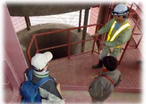
▲普段見られない箇所も見学できます (昨年度の見学会)