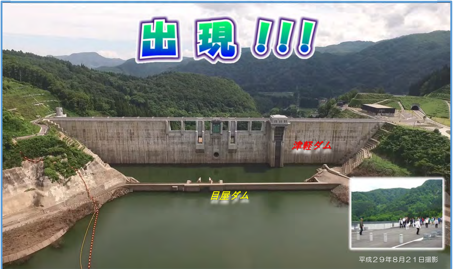
▲津軽白神湖の水位低下により出現した目屋ダム天端（手前が「目屋ダム」。奥が「津軽ダム」）▲

平成29年8月14日（月）、津軽白神湖に水没していた目屋ダムの天端が出現しました。目屋ダムは、昨年6月に津軽ダムの試験湛水終了後の貯水位低下時に顔を出しましたが、その後はダム湖に沈んでいました。平成29年度は、4月以降雨らしい雨が降らない空梅雨の状況となり、ダム湖の水位もそれに比例するかのように低下していき、とうとう目屋ダムの天端が顔をあらわしました。目屋ダムの天端が見えた状況での津軽ダムの貯水率は約30%ですが、目屋ダムとして見れば、「満杯」になる訳です。この約4ヶ月間、降雨が少ない状況の中でも津軽ダムの完成により岩木川へ安定的な水量を供給し続けることができたことから、津軽ダムは津軽地域で水不足による影響が出ることを防ぐ効果を発揮できたものと思います。