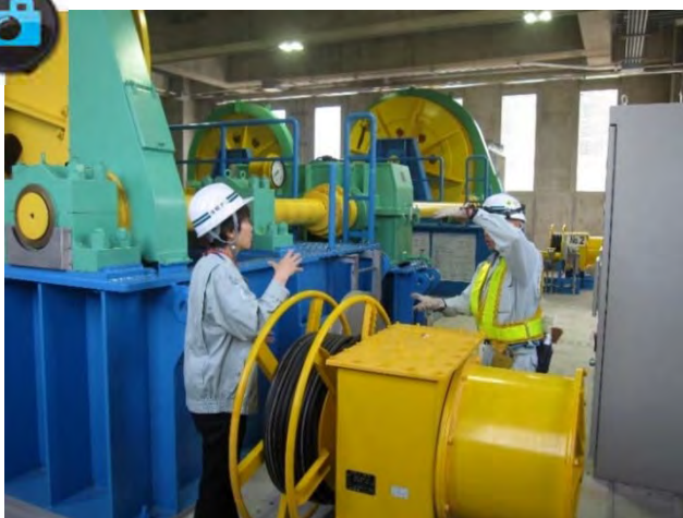
▲取水塔内部でのメンテナンスに関する説明▲