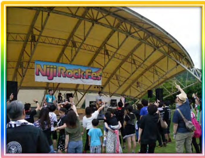
♪会場も一体となり盛り上がりました♪