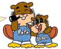
浅瀬石川ダムキャラクター あっちゃんパパ