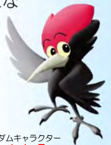
津軽ダムキャラクター ペッカー君

目屋ダムの出現した時期がお盆期間とも重なり、駐車場が満杯になる程の見学者が津軽ダムを訪れ、再び現れた目屋ダムの天端を見ては、歓声があがっていました。