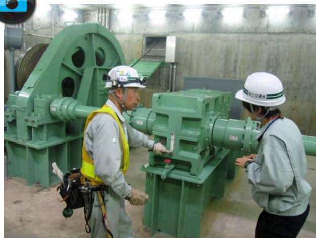
▲『コンジット予備ゲート』の役割について説明▲