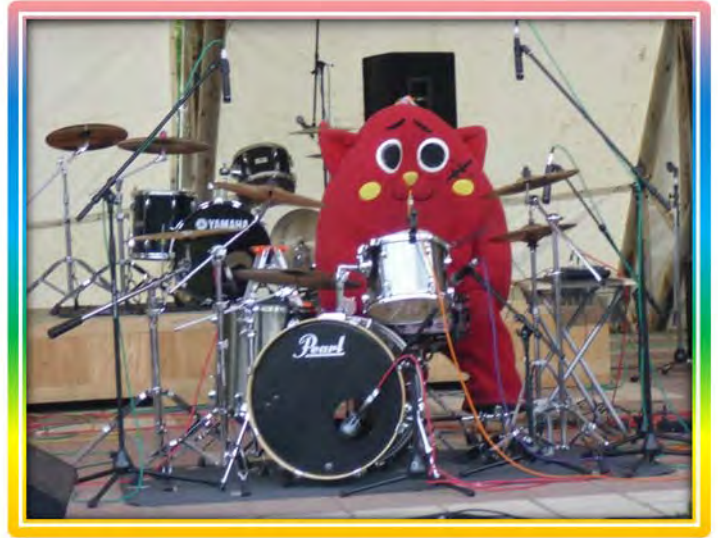
♪にゃんごすたーも参加！♪