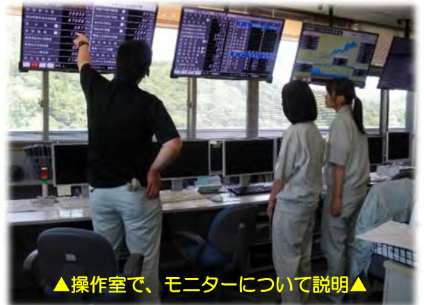
▲操作室で、モニターについて説明▲