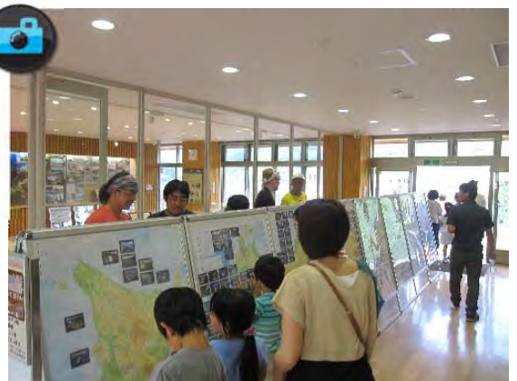
▲『全国ダムカード展』の様子。大盛況！！▲