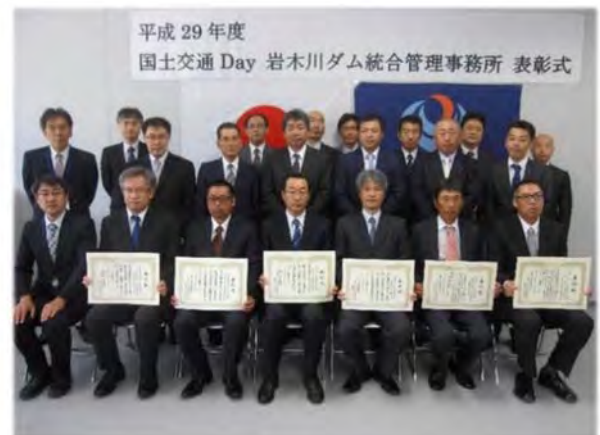
▲表彰されました皆様の記念写真▲