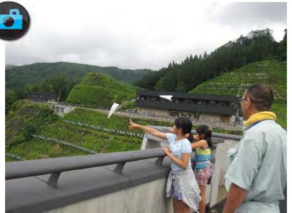
▲ダム天端からの『紙飛行機飛ばし』うまく飛んだかな！？▲