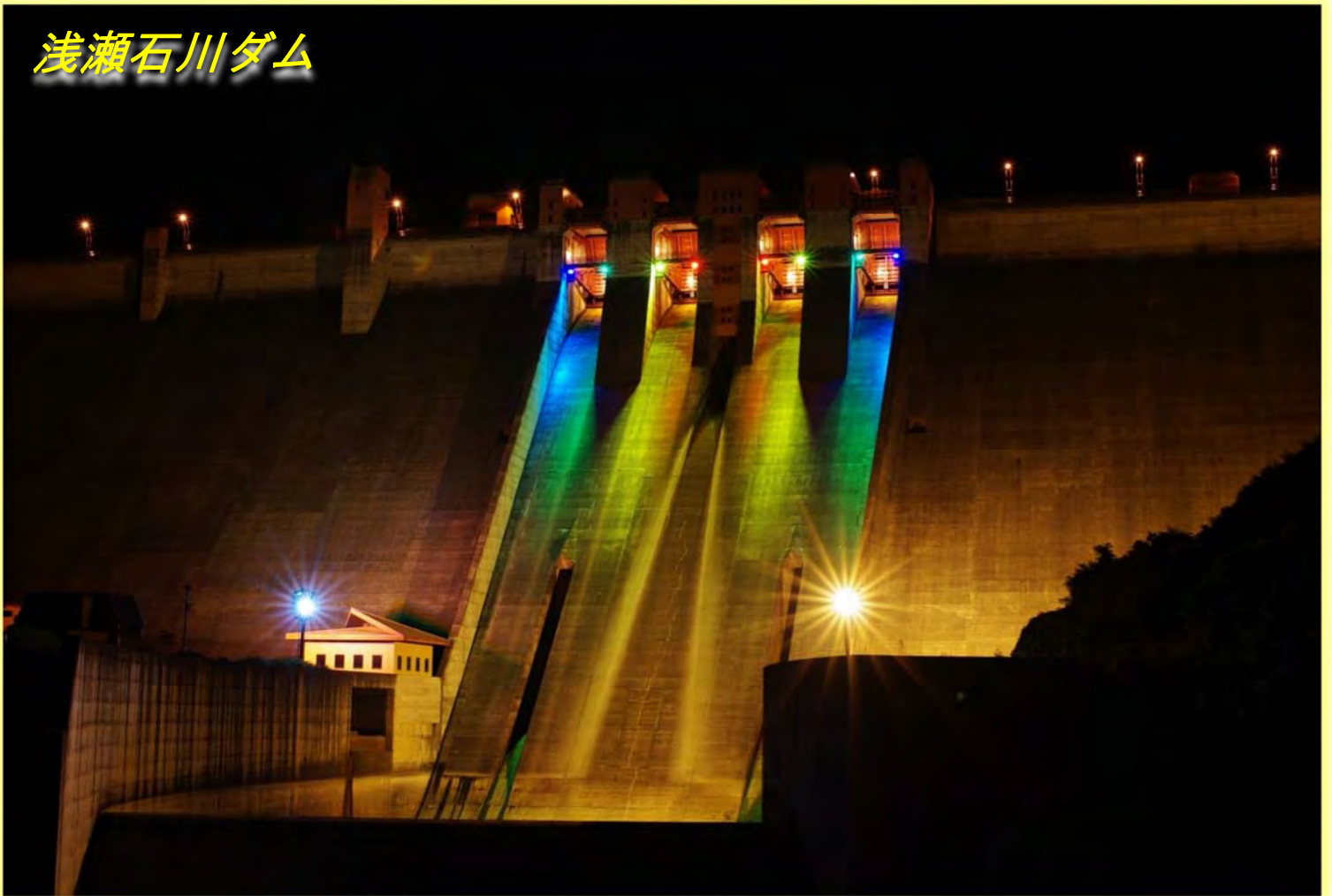
▲闇夜に照らし出された浅瀬石川ダム。レインボーカラーは圧倒的存在感！！▲

浅瀬石川ダム、津軽ダムの統合管理記念第2弾として、「夏のライトアップ・2017」を実施しました。浅瀬石川ダムは、平成29年7月21日（金）～31日（月）までの11日間、「虹の湖」にちなんだレインボーカラー、津軽ダムは、平成29年8月11日（金）～20日（日）までの10日間、カラーは事前告知しない「当日までのお楽しみ」として実施しました。期間中、夏休みとも重なり、大勢の見物客が訪れ大盛況のうちに幕を閉じました。