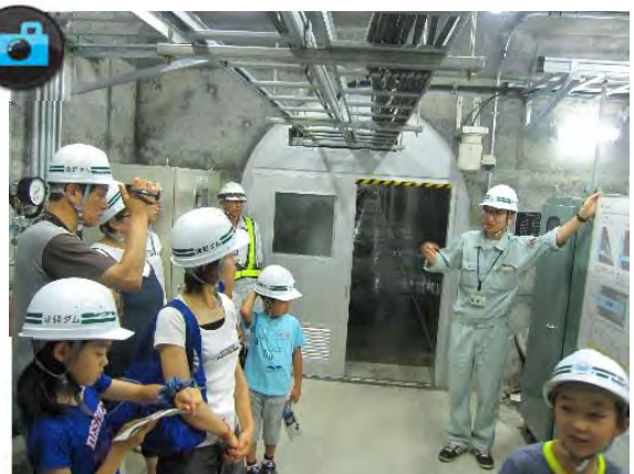
▲『ダム見学会』の様子。コンジットゲートについて説明。▲