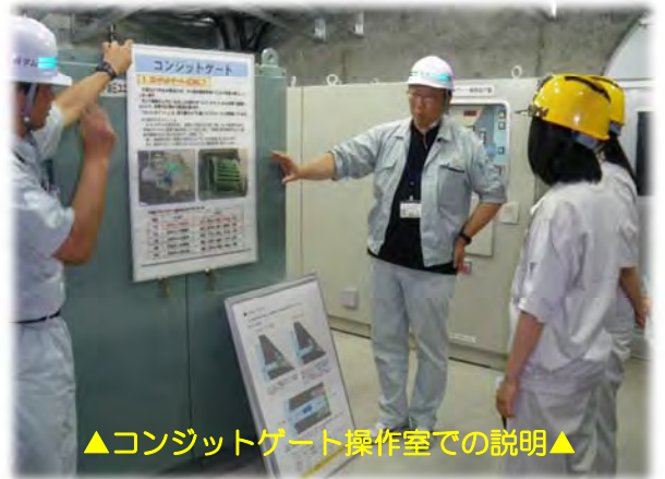
▲コンジットゲート操作室での説明▲