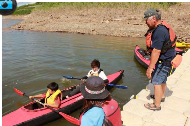
▲『カヌーによる巡視体験』の様子。うまくできるかな!?!▲