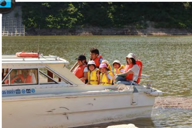
▲『モーターボート巡視体験』の様子。楽しそう!!▲