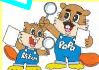
浅瀬石川ダムキャラクター アッチャンとパパ