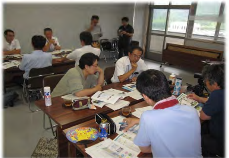
▲ダム見学終了後の協議会の様子▲