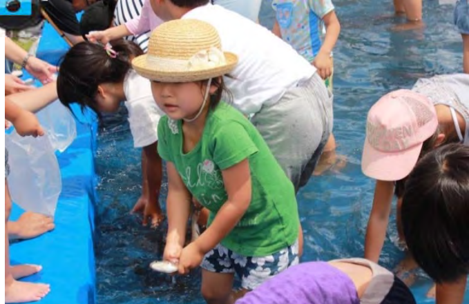
▲『さかなのつかみどり』上手につかめたね。すごい!!▲