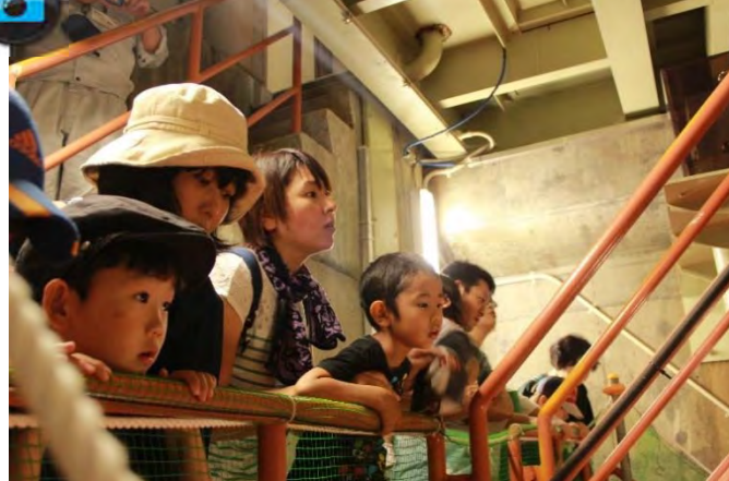
▲『ダム堤体内見学』の様子。初めて見るダムの内部に参加者も感動▲