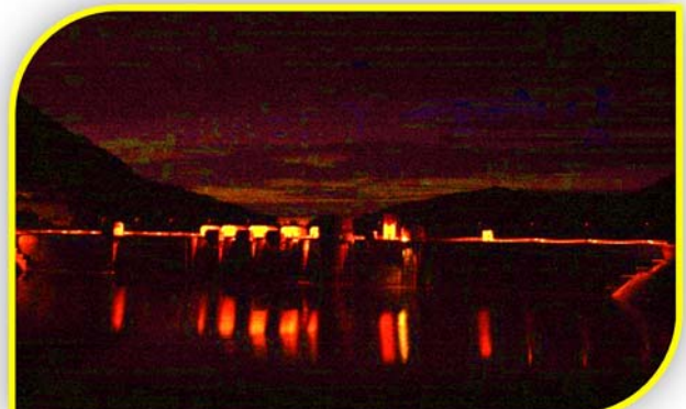
▲珍しいダム湖側からの写真。幻想的！？▲

浅瀬石川ダム、津軽ダムの統合管理記念第2弾として、「夏のライトアップ・2017」を実施しました。浅瀬石川ダムは、平成29年7月21日（金）～31日（月）までの11日間、「虹の湖」にちなんだレインボーカラー、津軽ダムは、平成29年8月11日（金）～20日（日）までの10日間、カラーは事前告知しない「当日までのお楽しみ」として実施しました。期間中、夏休みとも重なり、大勢の見物客が訪れ大盛況のうちに幕を閉じました。