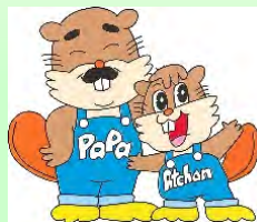
浅瀬石川ダムキャラクター アッチャンとパパ

当日は、天候にも恵まれ絶好の夏空の下、『カヌーによる巡視体験』や『モーターボート巡視体験』、専門のスタッフによる『ダム堤体見学ツアー』など、来場者は普段味わうことのできない貴重な体験をしました。また虹の湖公園では、『浅瀬石川ダムO×クイズ』などのステージイベント、せせらぎ水路特設プールでは『さかなのつかみどり』が行われ、参加者は大自然の中、楽しい夏の思い出をつくっていました。