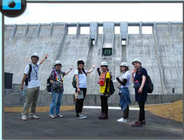
▲弘前観光コンベンション協会の皆様（7.11）▲