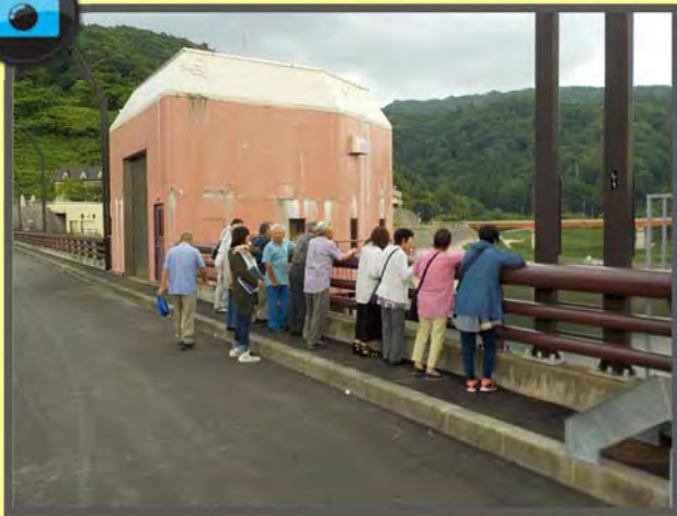
▲平賀町居公民館の皆様（7.19）▲