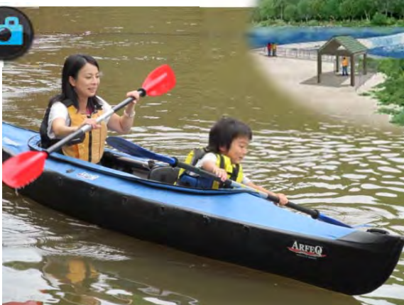
▲『カヌー巡視体験』楽しそう～！▲