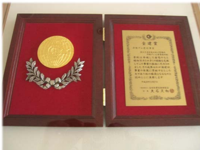
▲副賞の楯は資料館に展示しました▲

※全建賞とは、我が国の良質な社会資本整備の推進と建設技術の発展を促進するために設けられ、昭和28年の創設以来、日本の社会経済活動を支える根本的なインフラ整備や、その時々国民ニーズに沿った幾多の取り組みに受賞がなされています。