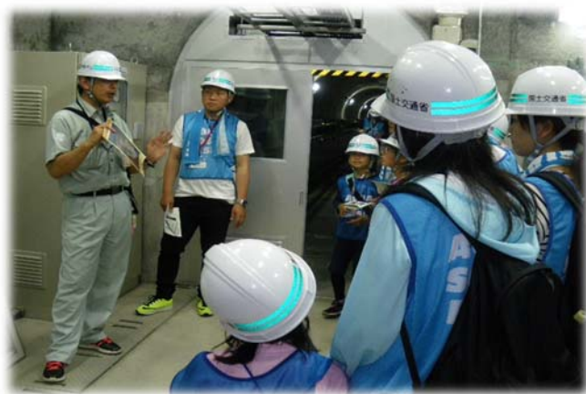
▲ダム見学での説明。みんな真剣に耳を傾けています▲