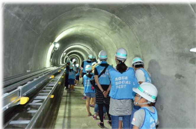
▲ダムの内部見学。「涼しい!!」▲