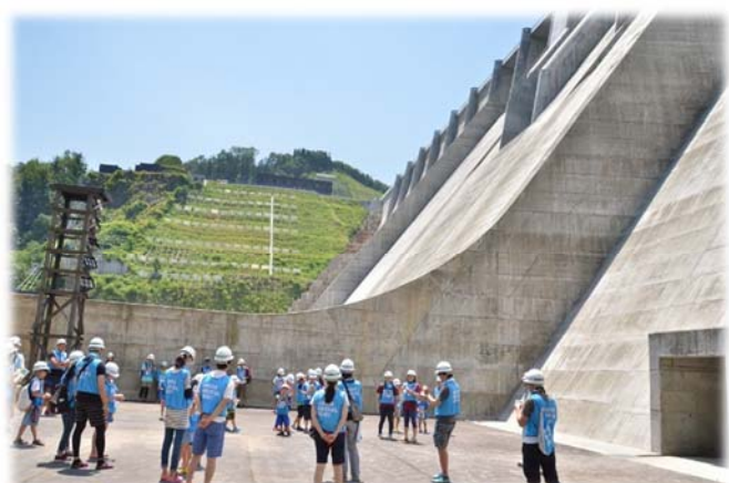
▲ダムを下から見上げました。「大きい!!」▲