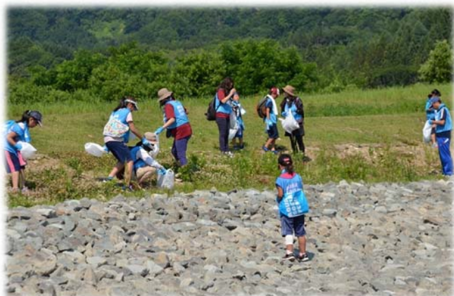
▲清掃活動の様子。みんな一生懸命▲