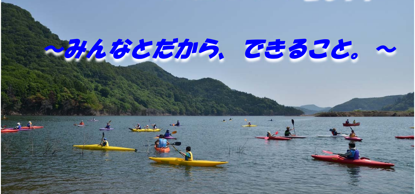
▲雄大な津軽白神湖でカヌー体験を満喫しました▲

平成29年7月8日（土）『AQUA SOCIAL FES!! 2017』青森環境保全プロジェクト「あおもりのきれいな水辺を守ろう」が津軽白神湖パークをメイン会場として開催されました。水遊びなどを通じて環境保全意識を育み、“青森の山と海を知り、貴重な自然を未来に残す”ことを目的に5年前から実施されている取り組みです。当日は、天候にも恵まれ、津軽白神湖パーク周辺での清掃活動、雄大な津軽白神湖でのカヌー体験、更に津軽ダムの内部見学と、とても充実した1日を過ごしました。