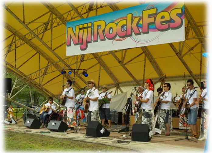
昨年度の様子 来場者約2,400人！