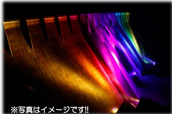
※写真はイメージです!!