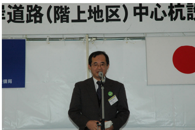
▲青森河川国道事務所長の挨拶