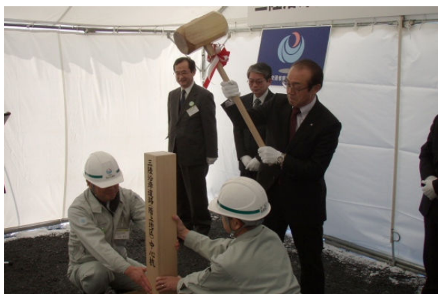
▲階上町長による中心杭打設