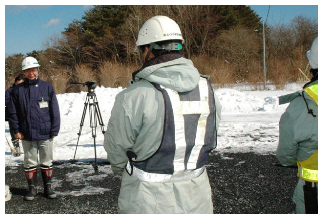
▲調査第二課長による測量開始宣言