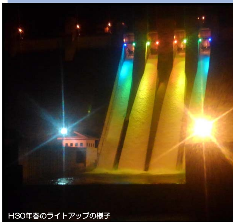
H30年春のライトアップの様子

浅瀬石川ダム“夏のライトアップ”は、『森と湖に親しむ旬間(毎年7月21日～31日)』の期間に合わせ実施します。浅瀬石川ダムの定番カラー“浅瀬石川ダムレインボー”で、涼やかにダム堤体を照らし出します。