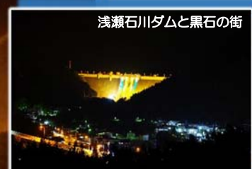
浅瀬石川ダムと黒石の街