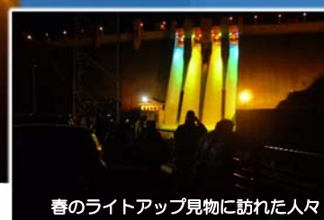
春のライトアップ見物に訪れた人々