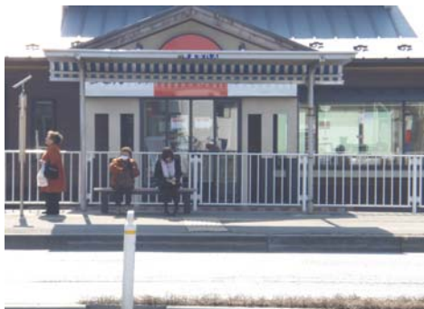
湊病院前バス停留所の利用状況