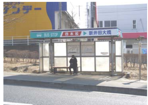
四本松バス停留所の利用状況