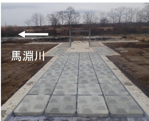
【取水口移設完成状況】