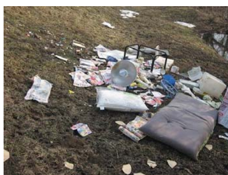
▲平成24年4月の堤防法面の不法投棄の状況