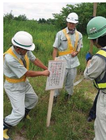
▲ 看板を設置している状況