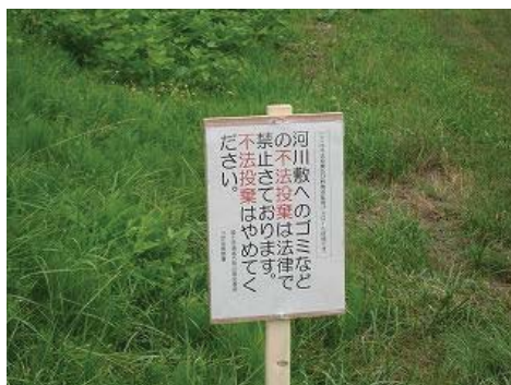
▲不法投棄は法律で禁止されています。河川環境の保護にご理解をお願いします。

また、五所川原市内においても、7月下旬から8月上旬にかけて、今年度五所川原市内の河川敷で不法投棄があった箇所、投棄防止・注意喚起を図るために注意看板を設置しました。看板は国土交通省と五所川原警察署との連名になっています。今後看板設置箇所は重点的にパトロールします。