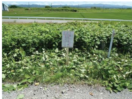
▲他の場所にも看板を設置しました。