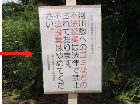
▲上記写真の場所に看板を設置しました。