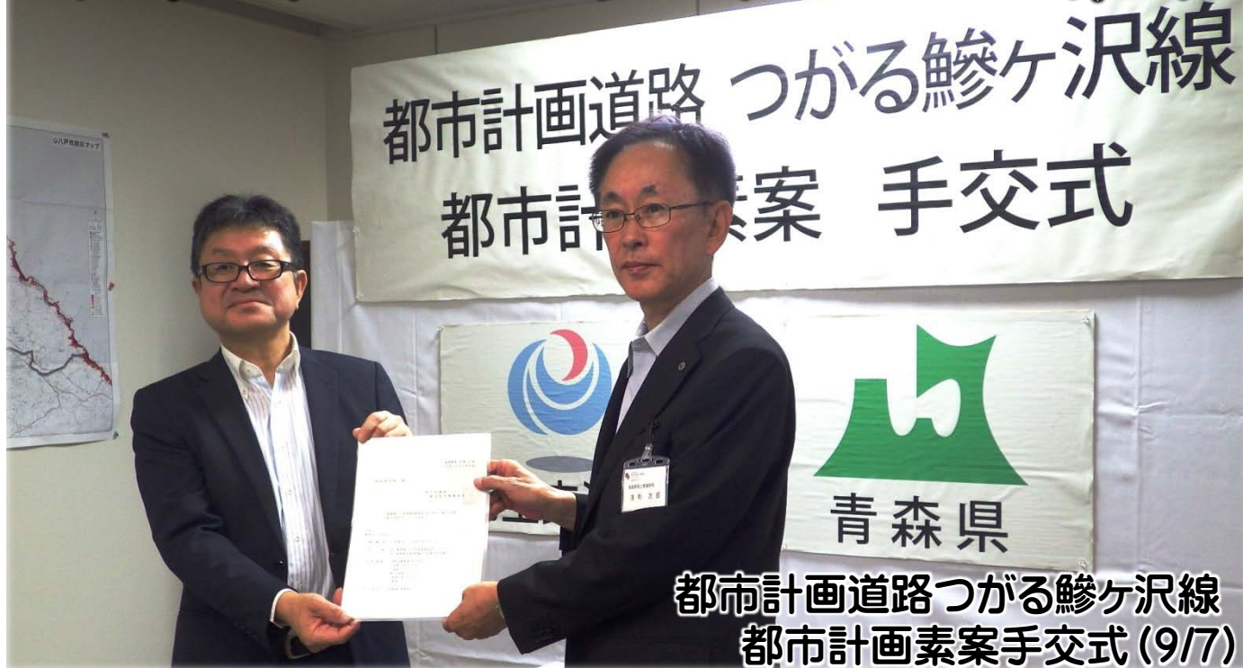
都市計画道路つがる鯉ヶ沢線 都市計画素案手交式(9/7)