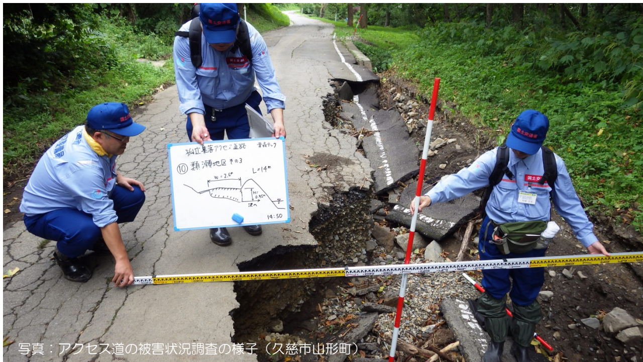
写真：アクセス道の被害状況調査の様子（久慈市山形町）