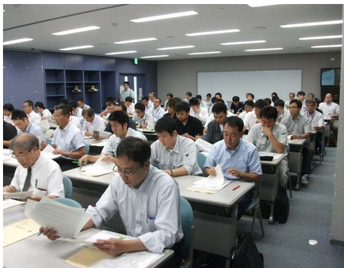
※写真(上・下)は今回の会議の様子