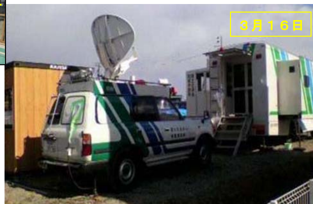
陸前高田市に衛星通信車を設営 (近畿整備局TEC-FORCE)