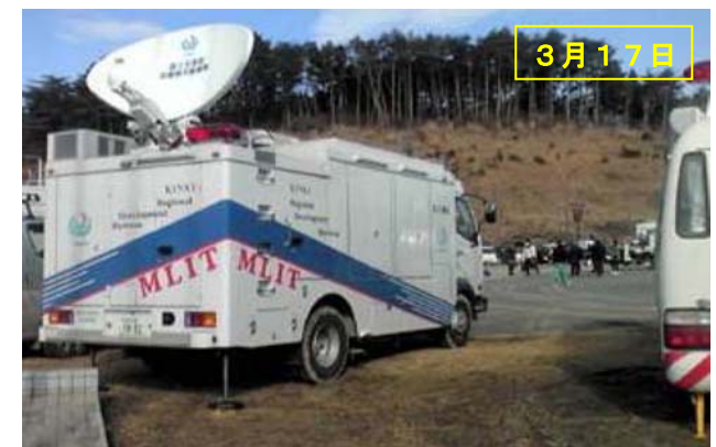
南三陸町に衛星通信車を設営 (近畿整備局TEC-FORCE)