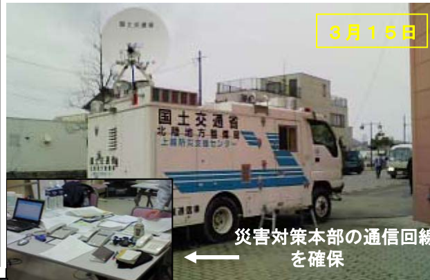
石巻市に衛星通信車を設営 (北陸整備局TEC-FORCE)