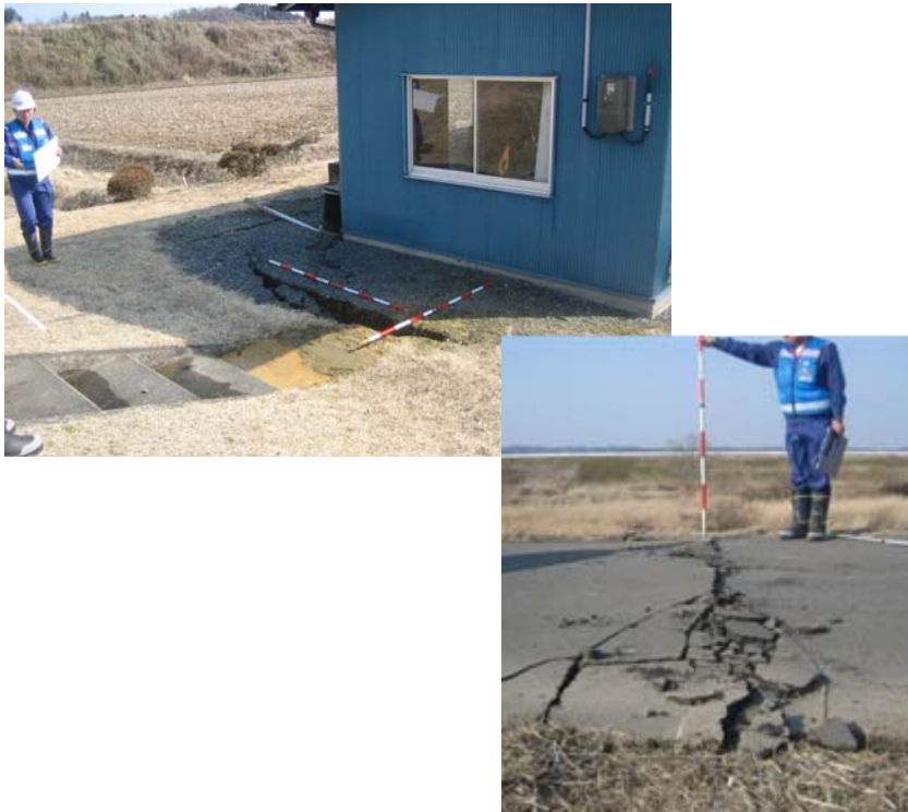
現地調査①・②(吉田川右岸)