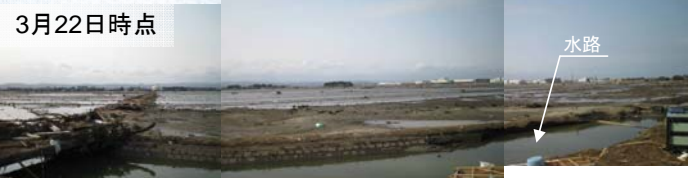
水位低下状況(水路水位で0.8m程度低下)