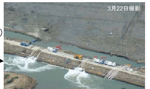
④ ポンプ車(30m 3 /min級)稼働状況