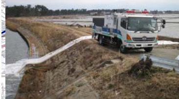
⑤ ポンプ車(30m 3 /min級)稼働状況