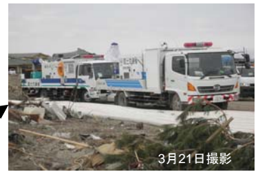
① ポンプ車(30m 3 /min級)稼働状況