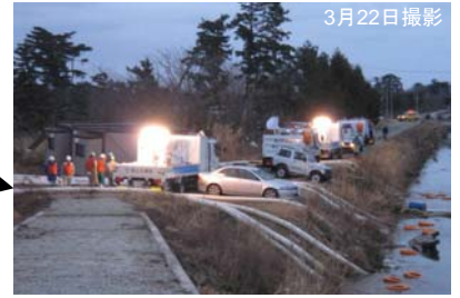
② ポンプ車(30m 3 /min級)稼働状況(夜間)