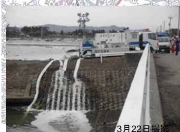
⑥ ポンプ車(30m 3 /min級)稼働状況