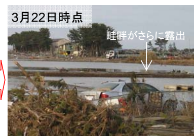
畦畔がさらに露出