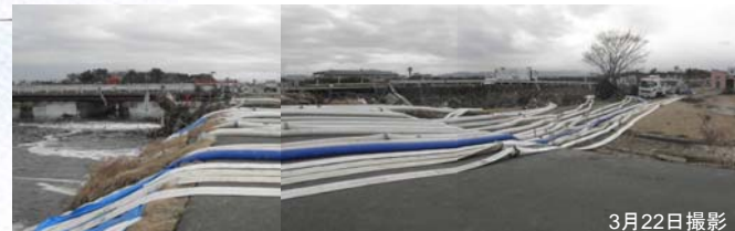
③ ポンプ車(60m 3 /min、40m 3 /min、30m 3 /min級)稼働状況