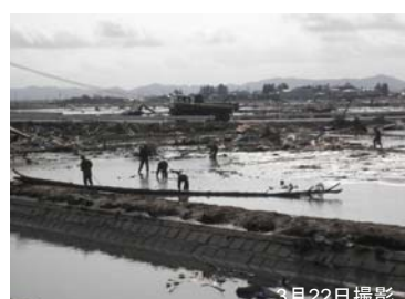
⑦ 自衛隊の搜索活動