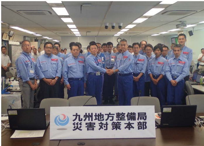
▲7月20日 応援TEC-FORCE 感謝の会 【九州地方整備局にて】