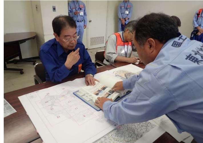
▲7月20日 朝倉市長へ調査概要を説明 【河川 第1, 2, 3班】