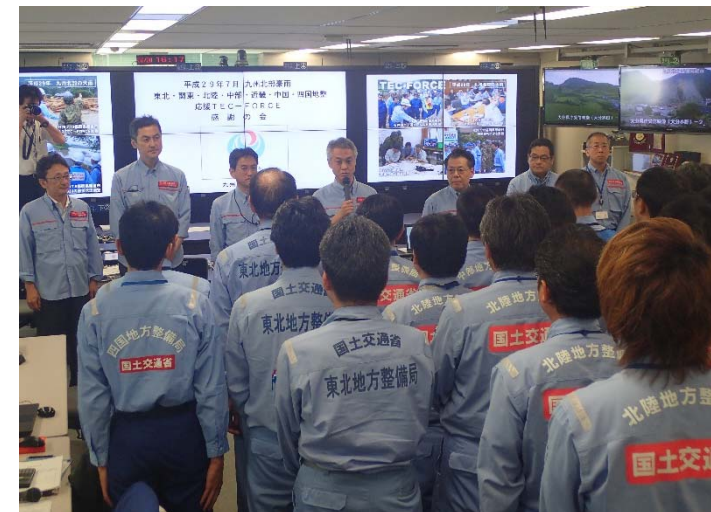
▲7月20日 応援TEC-FORCE 感謝の会 【九州地方整備局にて】