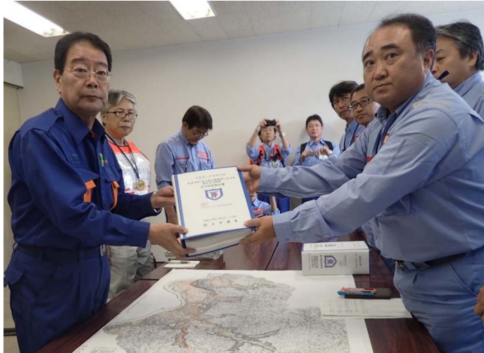
▲7月20日 朝倉市長へ調査報告書を提出 【河川 第1, 2, 3班】

■東北地方整備局では、河川災害が多数発生している福岡県朝倉市において、7月15日～7月19日まで34河川の被災状況調査をおこない、本日、朝倉市に調査結果報告しました。【現地活動は3班17名】