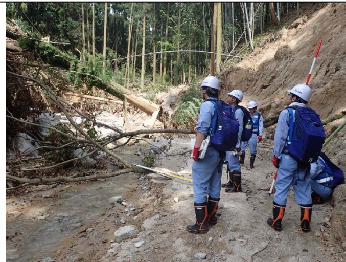
▲7月18日正信川(朝倉市)被災状況調査 【河川 第2班】