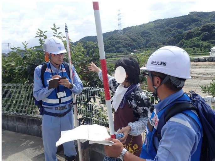
▲7月18日 住民からの聞き取り状況 【河川 第2班】