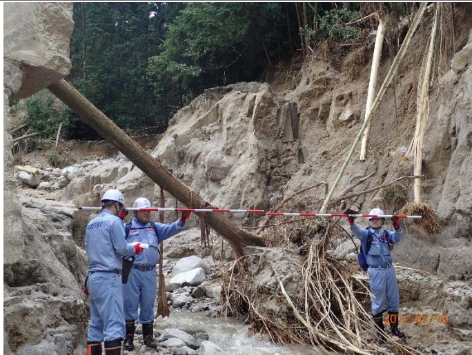
▲7月18日白木谷川(朝倉市)被災状況調査 【河川 第1班】

■東北地方整備局では、河川災害が多数発生している福岡県朝倉市において、被災状況調査を実施しています。 現在、7月18日までで17河川で調査が完了。【現地活動は3班17名】