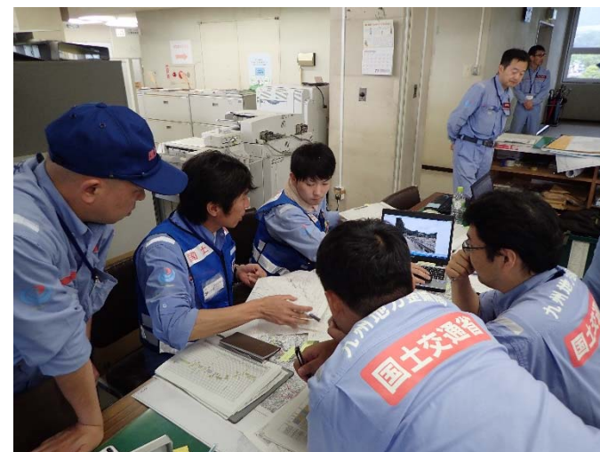
▲7月18日九州地整(朝倉市)との打合せ 【河川 第3班】