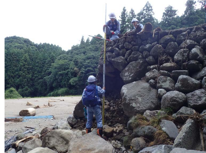
▲7月17日赤迫川(朝倉市) 被災状況調査 【河川 第2班】