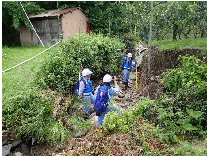
▲7月17日散田山川(朝倉市) 被災状況調査 【河川 第3班】