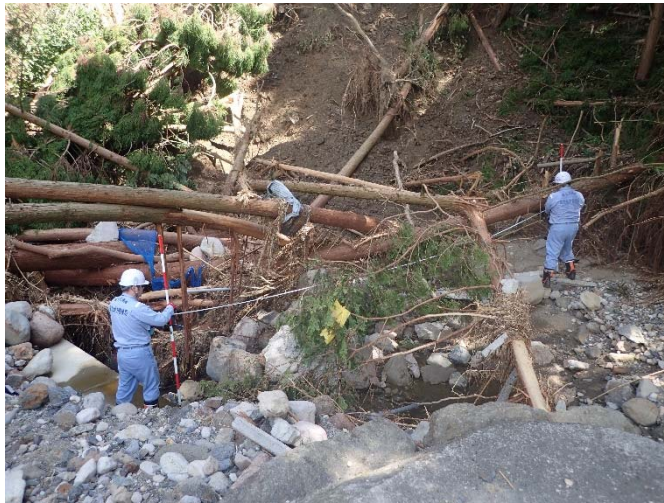
▲7月17日吉野原川(朝倉市) 被災状況調査 【河川 第1班】

■東北地方整備局では、河川災害が多数発生している福岡県朝倉市において、被災状況調査を実施しています。 現在、7月17日までに12河川が調査が完了。明日から新たに5河川について調査をおこないます。【現地活動は3班17名】