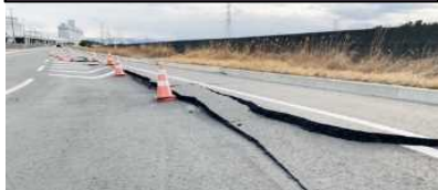
臨港道路5号ふ頭内線