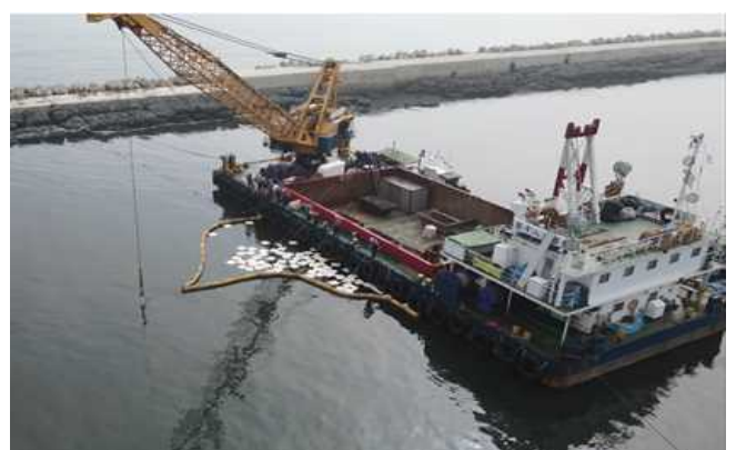
▲埋浚 吸着マットによる油の回収作業